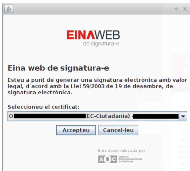
Il·lustració 5: Selecció del certificat digital que escaigui.