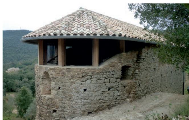
Evolució de les obres de restauració