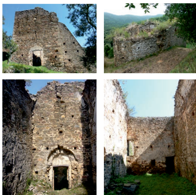
Estat inicial del conjunt