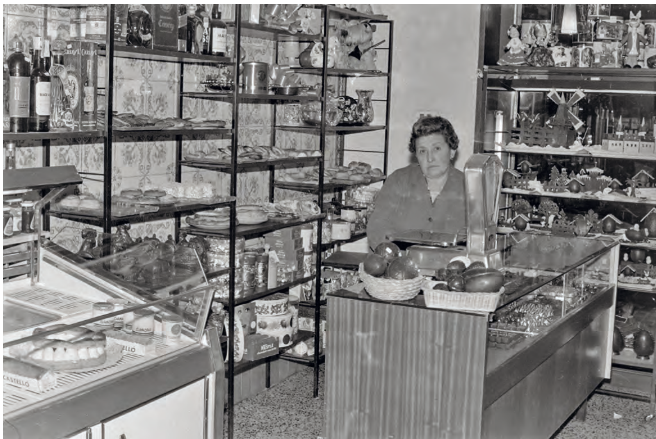
>> Mones de Pasqua a la pastisseria Can Castelló, al carrer de Santa Clara de Girona, 1972.

més emparentats amb el calendari. També es cuinen plegats, en família. Són un ritual: panellets, coques, brunyols. Un ritual marcat per les estacions, els mesos. Un ritual que esperem, que fins i tot trobem a faltar i que, quan