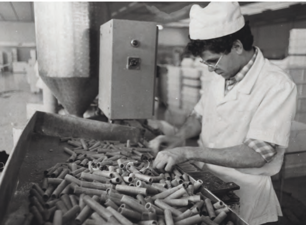
>> Fàbrica de galetes Trias. Santa Coloma de Farners, 1987.

Cal Enric, de Castellfollit de la Roca, i les de Can Graupera, sota les voltes neoclàssiques de Martí Sureda, a la carretera de Palamós a la Bisbal; en el triangle de cabell d'àngel de la pastisseria Nèctar, de Cassà de la Selva; en els torrons de Can Puigdemont, d'Amer, o en la flaona de Figueres i Cadaqués, una pasta de crema en forma de lluna amb gust de canyella i llimona. Igualment, en els cerdans, amb avellanetes i un toc d'anís, de Can Gil, de Llúvia, o en els jaumets de Sant Hilari Sacalm, també fets a partir d'aquesta fruita seca, inspirats en un personatge del poble, Jaume Traveria i Riera.