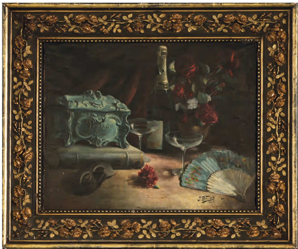
>> La nit de Carnaval, (1941), oli sobre tela de 48 x 62 cm (col·lecció Boix Reig) de Josep Beulas (Santa Coloma de Farners, 1921-Osca, 2017). Quadre de postguerra, iniciàtic en l'obra de Beulas, en què apareix una capsa de teules refistolada i segurament imaginada.

Qui escriu aquestes línies, diabètic diagnosticat, hauria volgut que l'avellana negreta ( Corylus avellana ) hagués estat la protagonista de la majoria de confits, galetes, coques o torrons de la demarcació selvatana per antonomàsia. No ha estat així: no he pogut demostrar-ho, tot i haver-n'hi. Els edulcorants naturals, com la mel i molt més tard el sucre, primer d'origen canari, andalusí o llewantí, en producció limitada i solament a l'abast dels potentats com a llepolia excepcional, i més tard provinent de les colònies castelles del Carib, fins a l'actualitat, han estat el fil conductor de gairebé tots els confits i confitures, més tard pastissos, que han format la nostra memòria gastronòmica ritual. Cal tenir present que en un principi la mel i més tard el sucre endolcien, però —i això és important— també conservaven vegetals: fruites, flors o arrels. L'altre ingredient indiscutible en la confiteria selvatana, i mediterrània, és l'ametlla ( Prunus dulcis ), en pols, trencada o sencera. A la Selva, a més, hom pot afegir-hi les avellanes i els pinyons. Un altre indispensable de la confiteria és la farina de blat, sigui per pastar la massa per a melindros i coques de tot tipus o per fer pa i panades. Un tercer component de rigor són els ous: sencers, les clares batudes o els rovells, que es transformen en gemes. Tots, però, amb les proporcions i preparacions adequades, necessiten l'es-