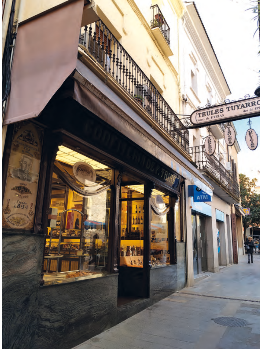
>> Façana de Can Tuyarro, mítica confiteria de Santa Coloma de Farners, fundada el 1894.