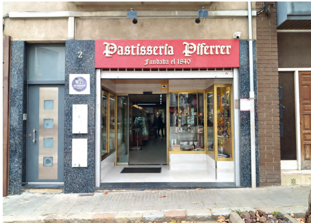
>> L'antiga Pastisseria Piferrer, d'Anglès, fundada el 1840.

claus, les banyes de gasela ( kab al-gazal ), el feqqas o el mhansha , que tant agraden als que han arribat des del Marroc. Ens construïran un altre paradigma, un altre futur llaminer?