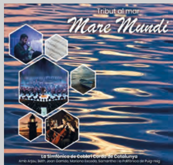
SIMFÒNICA DE COBLA I CORDA DE CATALUNYA. Mare Mundi . Música Global, 2025.