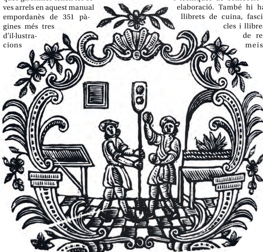
>> Ofici de flequer segons un boix de la Tipografia Carreras.