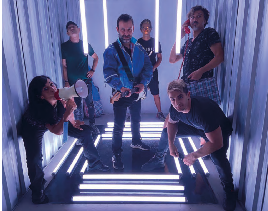
>> En el rodatge del videoclip Zombies del grup Mazoni.

Un altre que vaig fer es deia 3r-3a . S'hi seguien les reformes d'uns habitatges. Però el programa del qual estic més orgullós de tots, en l'aspecte acadèmic, és Colors en sèrie , un viatge emocional i psicològic per tots els colors. Era un programa molt atemporal, que es va emetre el 2007 al Canal 33 i que vam crear amb el realitzador Òscar Lorca. Amb els colors es comuniquen moltes