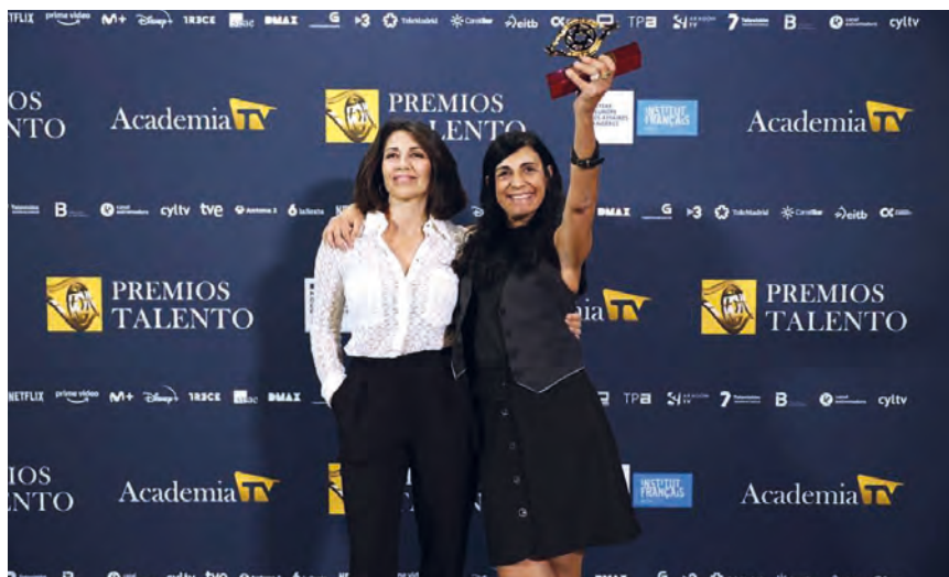
>> A l'entrega dels premis Talento de l'Acadèmia espanyola de televisió, amb l'actriu Alicia Borrachero.