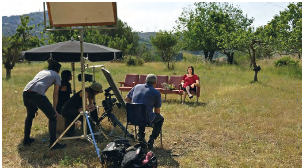
>> Rodatge amb l'equip de «La gran il·lusió», durant l'entrevista a l'actriu Laia Marull.

demanar-me si podia realitzar un vídeo amb un pressupost bastant ajustat. La meua idea era elaborar-lo amb una càmera súper-8 que tenia. Vaig anar a Tarragona, al seu local d'assaig. Quan en Lluís Gavaldà i en Joan Reig em van rebre, vaig veure que no hi era gaire benvinguda perquè trencava esquemes. Per a mi, les seves cançons tenien un to molt festiu i de festa major, però aquesta no. Era més intimista. Així que jo els deia que no somriguessin i que tinguessin una actitud grunge davant la càmera, de no fer res. Volia crear una cosa molt nostàlgica i visceral. En Lluís no acabava d'entendre què feia. Quan van rebre el videoclip, em vaig emocionar quan em van dir que havia retratat molt bé l'essència de la cançó.