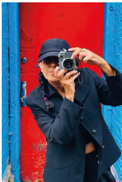
>> Captant instantànies amb una de les seves càmeres.

Era una inconscient: sense gens de por em vaig llençar a fer-lo. Em van trucar des del segell discogràfic del grup per