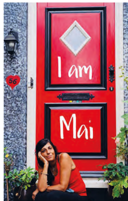
>> Asseguda davant d'una porta a Amsterdam.