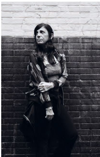
>> Davant d'una paret de maons.