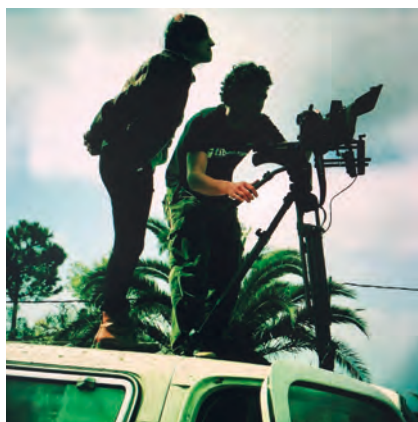
>> En el rodatge d'una campanya d'estiu amb Els Amics de les Arts .