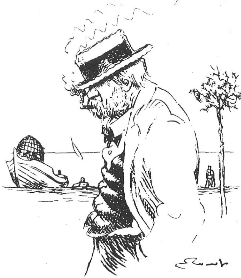
Ruyra al passeig de Blanes, segons un extraordinari apunt de Joan Junceda.

l'estudi del dialecte blanenc per tal de «literaturitzar-lo».