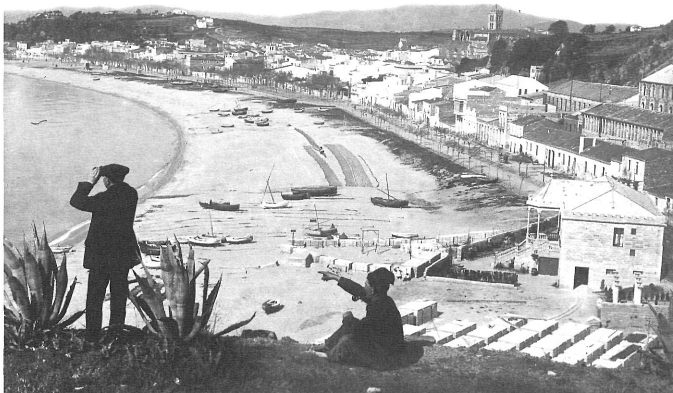
En aquesta postal de 1918 es respira tot l'encís de Blanes que va seduir Ruyra.