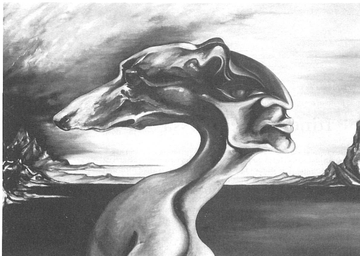
"Quan se'ns va morir el nostre gos, que per a la meva dona i per a mi era molt més que un animal, a l'Empordà vam trobar la necessària serenor" ( "Henry" , oli de Horst Heller).