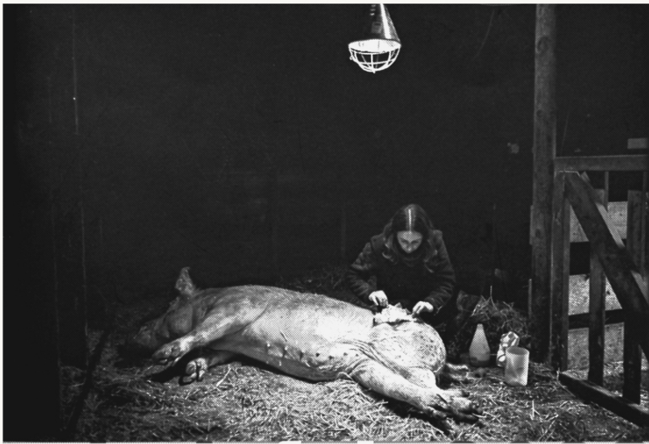
PAU DE LA CALLE

Del 7 al 29 de febrer, de dilluns a divendres de 10 a 20 h Casa de Cultura de Girona, sala d'exposicions de la primera planta