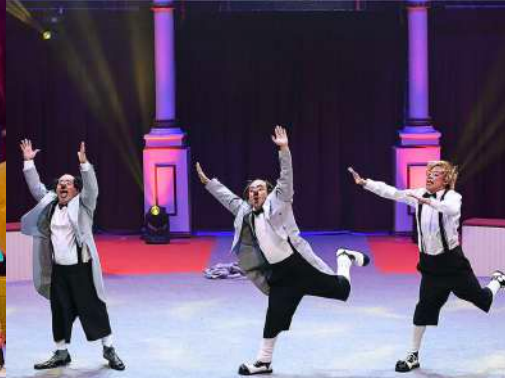
Los Caluga - Pallassos