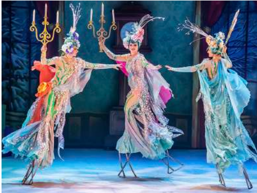
Snow Queens – Xanqueres