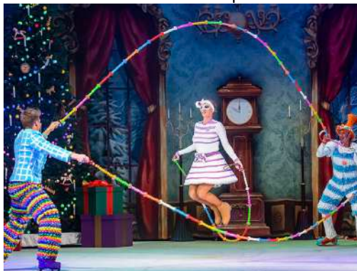
Carnival Troupe – Salts de corda