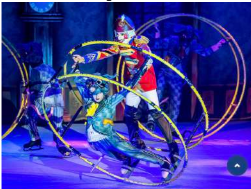
Nutcracker's mica – Rodes alemanyes