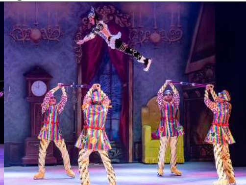
Gingerbread on air – Barra russa