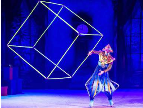
Fluor Team – Cubs giratoris