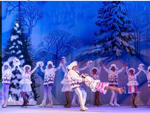
Nikulin Ice Team – Patins acrobàtics