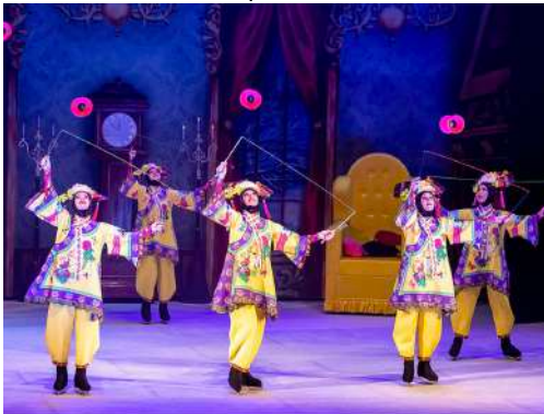
Imperial Games – Diàbolos