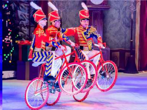
Group on wheels – Monocicles & bicicletes