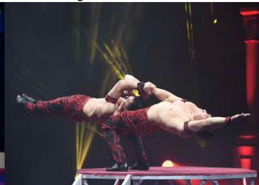
Giang Brothers – Mà a mà