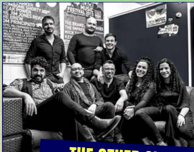
THE OTHER SIDE TRIBUT A PINK FLOYD