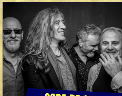
SOPA DE CABRA