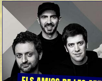
ELS AMICS DE LES ARTS