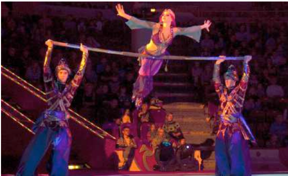
Doble barra russa