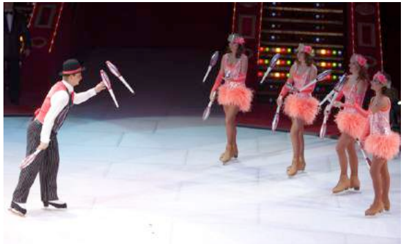
Malabars en grup