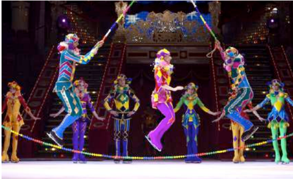
Salts a corda