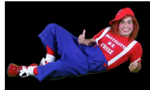
Pastelio de Xile - Pallasso