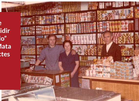
El "colmado" de Mata (Porqueres), obert a totes hores.

Un matrimoni de ramaders va decidir obrir un "colmado" on els veïns de Mata trobaven productes alimentaris a qualsevol hora del dia.