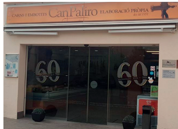
La façana de la carnisseria avui.