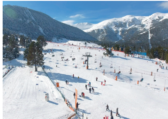
Una de les pistes de La Molina en l'actualitat.

La pràctica de l'esquí va fer-se popular a Catalunya a principis del segle XX, quan joves de les classes benestants van començar a ascendir les muntanyes nevades, tal com es feia al nord d'Europa. A La Molina, els primers esquiadors van arribar a partir del 1908, ja que juntament amb Vall de Núria era l'indret més accessible des de les principals ciutats catalanes. Es van organitzar les primeres competicions i concursos esportius i amb això l'arribada d'avenços com la instal·lació del primer telègraf a l'hostal de La Molina, per comunicar els resultats del 1r Campionat Internacional. L'any 1922, es va inaugurar el primer ferrocarril que comunicava la vall. El Centre Excursionista de Catalunya (CEC) va inaugurar el Xalet de La Molina, per allotjar els seus socis, l'any 1925. El 28 de febrer de l'any 1943, el Mossèn Camil Riera, de Vic, inaugura el primer telesquí d'ús comercial