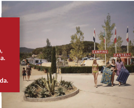
El càmping als anys 70.

La clientela és principalment catalana, holandesa, belga, anglesa i francesa. Disposa de 4,3 hectàrees i 195 places d'acampada.