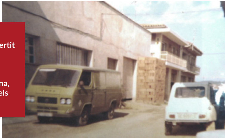
Inici de la construcció de l'actual obrador.