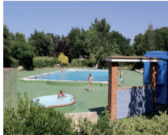
La piscina del càmping en l'actualitat.