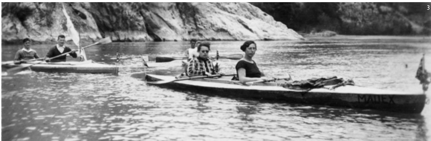
Fotografies: 1. Ciclistes al velòdrom de Sants. Gabriel Casas. ANC / 2. Vista sobre el circ de Lyds, des de Puylané. 1912. Emili Juncadella. Diputació de Barcelona / 3. Baixada per l'Ebre, 1929. Arxiu Comarcal del Baix Ebre.