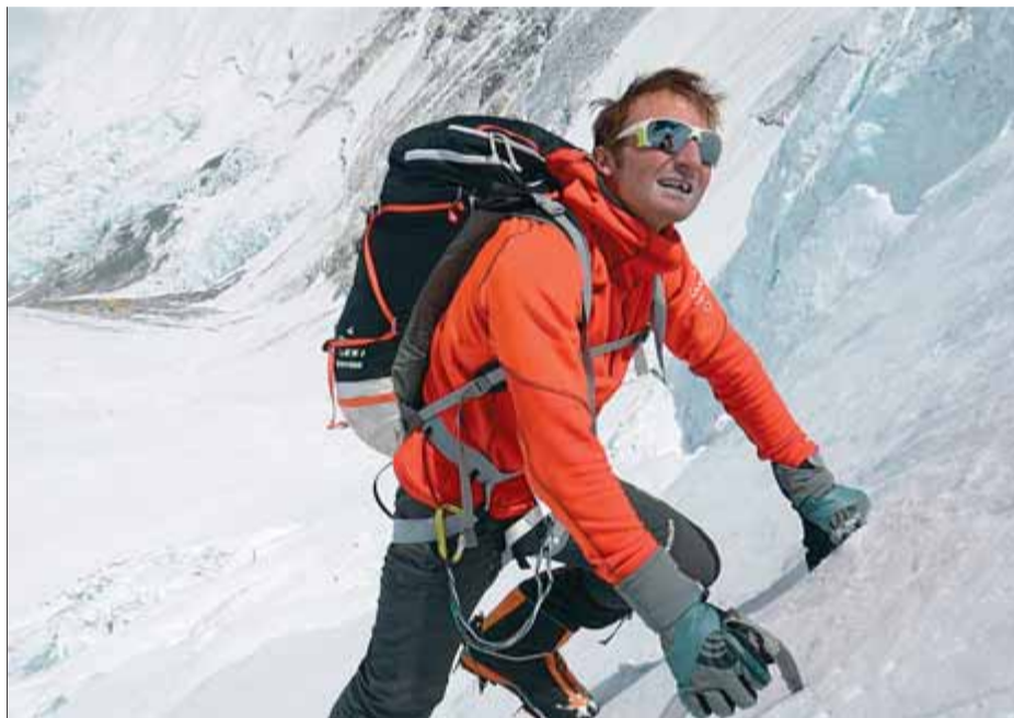
L'alpinista suís Ueli Steck, en una ascensió a l'Everest