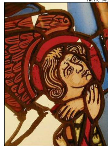
Detall d'un dels vitralls.