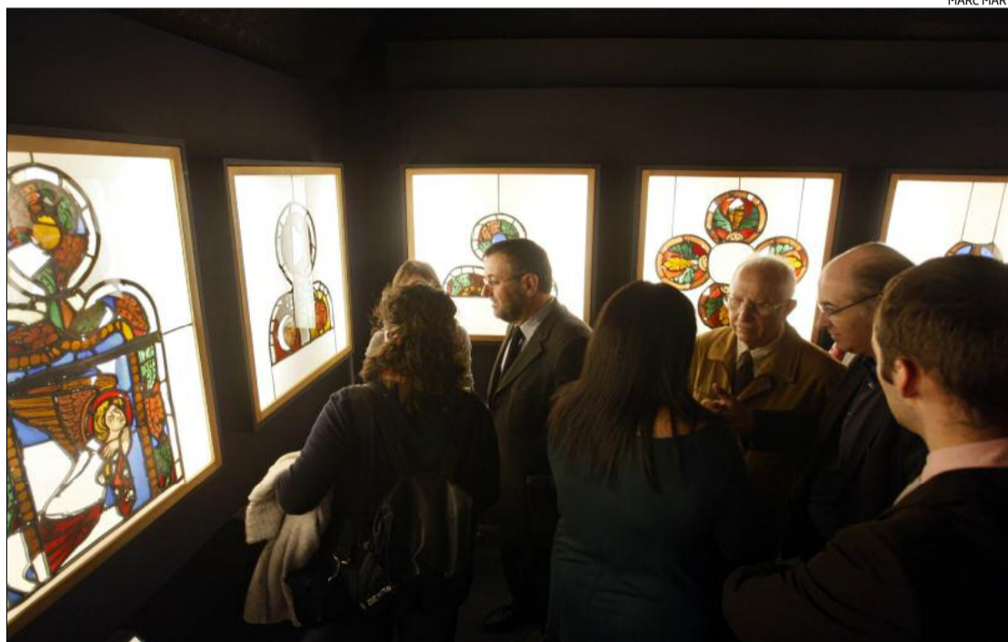
La mostra, espectacular, va ser inaugurada ahir al matí i es pot visitar fins al 22 de maig.

Les taules de vitraller són en dues posts de fusta en les quals es conserva el dibuix preparatori per a la realització d'un vitrall. Tot i que el procés de creació de vitralls el trobem documentat en diversos textos medievals, aquestes dues taules són l'únic testimoni material conservat a Europa. Els traços geomètrics que s'hi representen