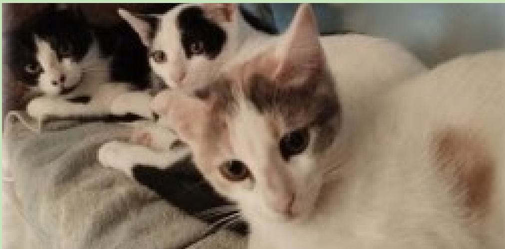
Aquests són els tres gats pendents d'adopció.

Fruit d'aquesta actuació al carrer Olot d'en Bas, s'han capturat i donat en adopció a cinc femelles i dos mascles, s'han capturat i acollit tres exemplars més que resten a l'espera que algú els adopti i s'han capturat 7 exemplars adults més que han estat esterilitzats i retornats a la colònia.