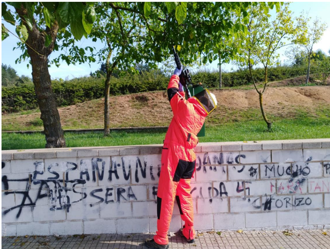
Tècnic d'una empresa de control de plagues inactivant un vesper amb els EPI corresponents