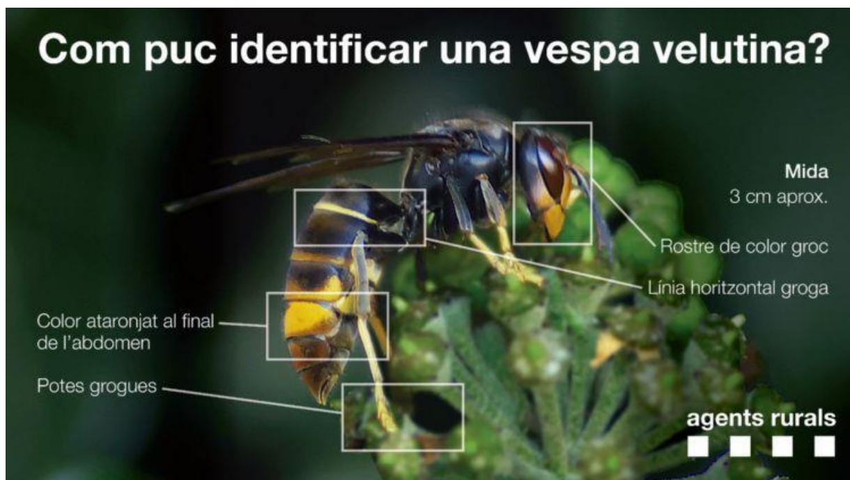
Característiques de la Vespa velutina. Cos d'Agents Rurals

La seva mida oscil·la entre 17 i 32 mm de llargària, més gran que Vespula germanica (vespa d'olla autòctona més comuna) i una mica més petita que Vespa crabro . Les obreres i les reines (femelles fecundades) no es poden diferenciar morfològicament. Si bé a la primavera les obreres solen ser clarament més petites que les reines, a la tardor només el major pes i amplada del tòrax de les noves reines permet diferenciar-les de les obreres.