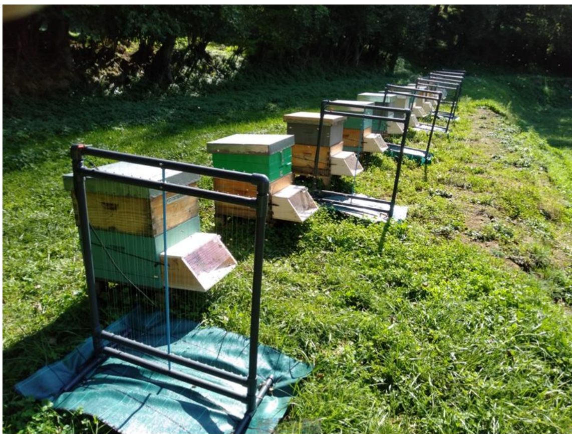
Abellar amb arpes elèctriques i morrioneres.

descàrrega i resten capturades en contenidors. Les morrioneres (del francès musélières) són senzills dispositius inserits al trespador amb una reixa d'uns 6 mm que permet l'entrada i sortida de les abelles de la mel però que no permet l'entrada de les vespes (o la sortida, segons el model). Alhora, en disposar les abelles d'una major superfície de la rampa de sortida i entrada sense pressió de vespes, en disminueix l'estrès i afavoreix recuperar l'activitat recol·lectora.