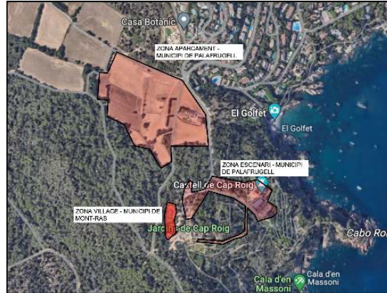
Imatge Ubicació de l'activitat

Les coordenades UTM de l'activitat són les següents: