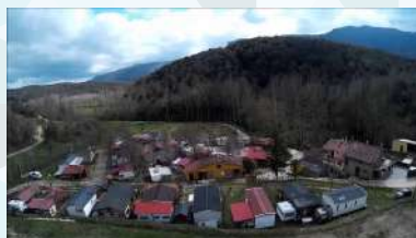
Càmping Molí de Vilamala

Dances, cançons, ballaruga, con- tes i molt més per fer saltironar i ballar la mainada amb la partici- pació de tota la família.