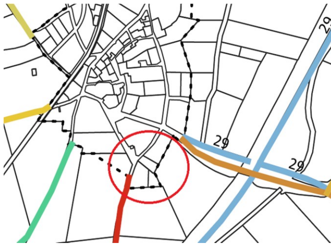
Fragment del Mapa de l'inventari.

L'al·legat manifesta que el tram de camí que transcorre pel costat sud de la seva finca urbana del Carrer del Mar, 15 no apareix a l'inventari de camins. Un cop revisada la documentació veiem que l'esmentat camí, perllongació del carrer anomenat Camí del Pou, està classificat com a zona urbana pendent d'urbanització. En l'inventari efectuat només es cataloguen els camins situats en sòl rústic.