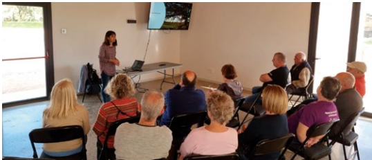
Trobada amb els veïns de Canet.

les propostes fetes pels veïns i veïnes, que pràcticament s'han implementat en la seva totalitat, i en l'última part de la reunió l'alcaldeessa va cedir la paraula als assistents perquè fessin propostes, suggeriments o expressessin les seves queixes. Aquestes s'han recollit en una acta que es comentarà en la reunió de retorn que es farà a la tardor.