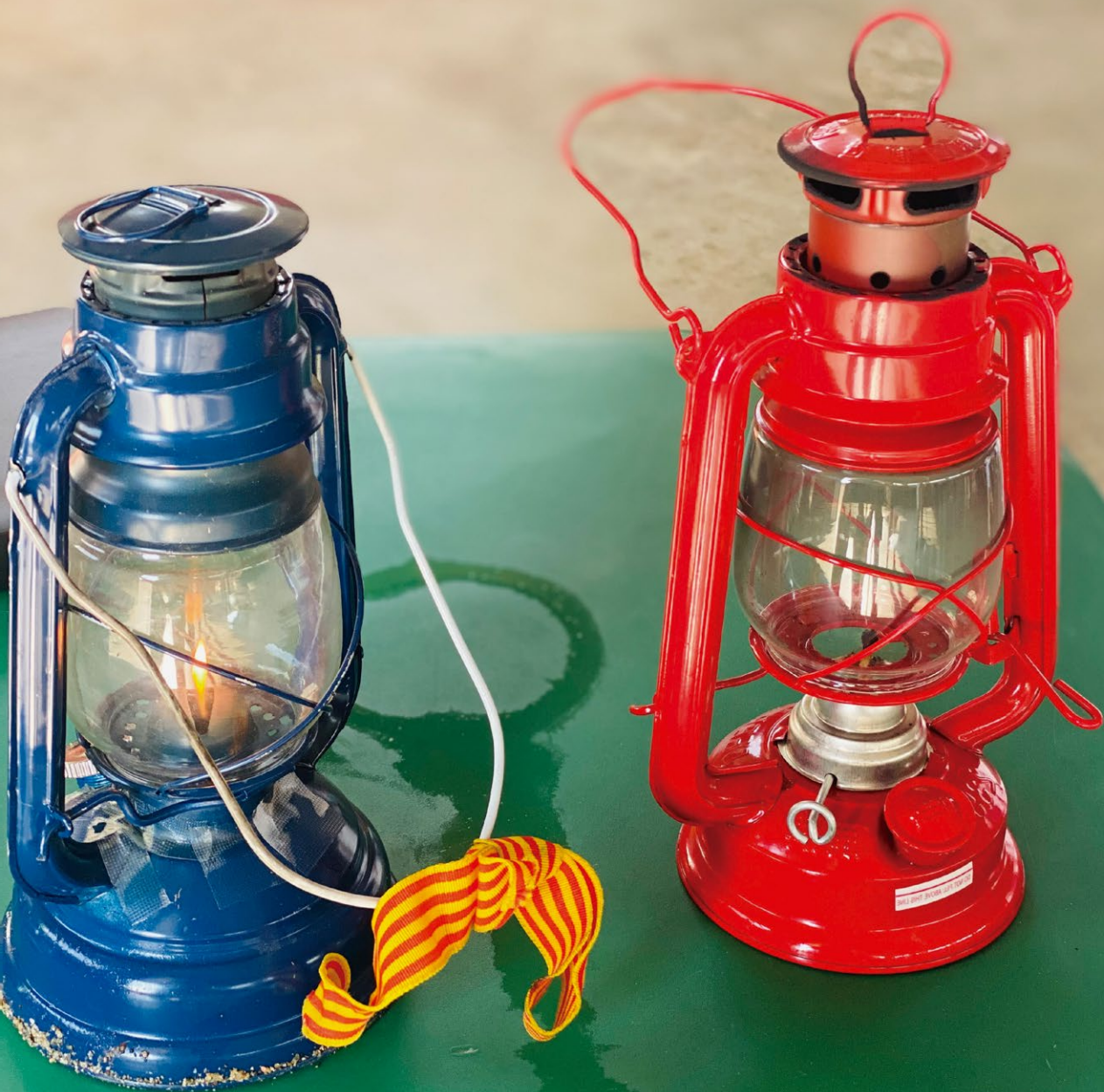
Flama del Canigó. Autora: Anna Peris