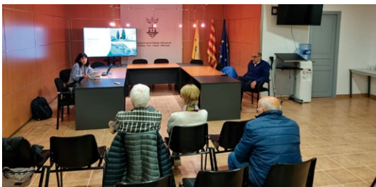
Trobada amb els veïns de Marenyà.