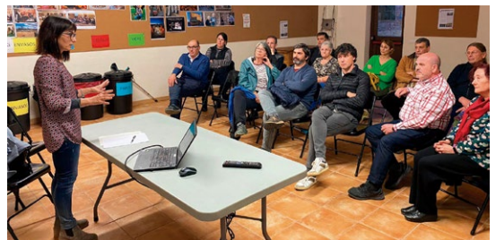
Trobada amb els veïns de Tor.