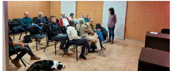
Trobada amb els veïns de la Tallada.