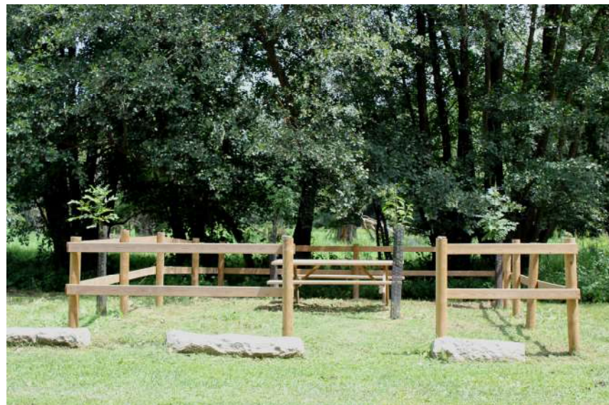
Aparcament dissuassiu i zona de descans i pícnic