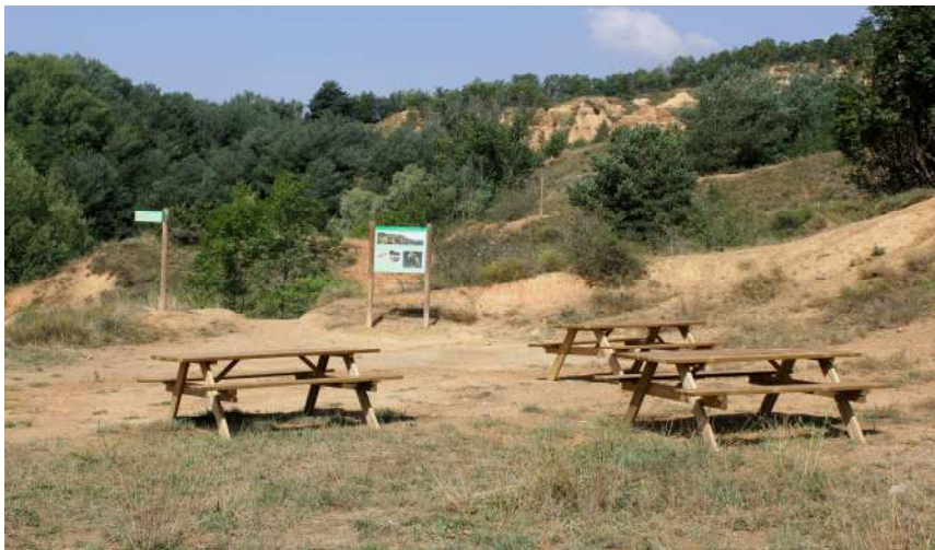
Zona de pícnic i informació

L'execució dels treballs ha seguit el calendari previst i l'obra ja està pràcticament acabada. Només falta plantar els arbres a la zona de pícnic, que es farà durant l'època més adequada perquè els arbres tinguin un creixement òptim.