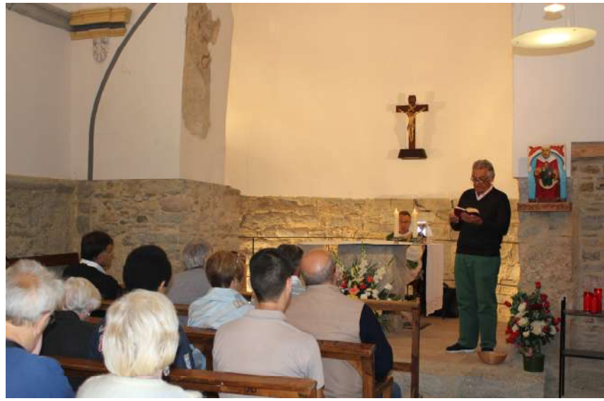
Missa a l'ermita de Quadres