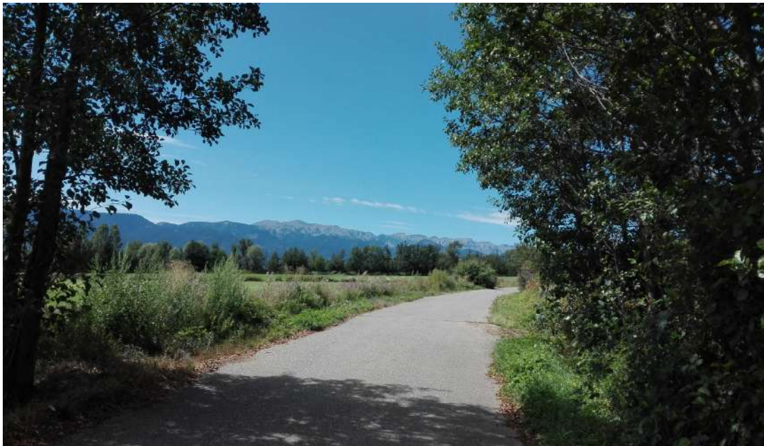
Camí d'All a Olopte

Nova edició de la caminada popular d'All. Aquest any, la ruta ens va portar d'All fins el poble d'Isòvol, per després seguir pel sender paral·lel al riu Segre. El circuit va acabar a la Plaça Major d'All, on els caminants van poder gaudir d'una fideuada.