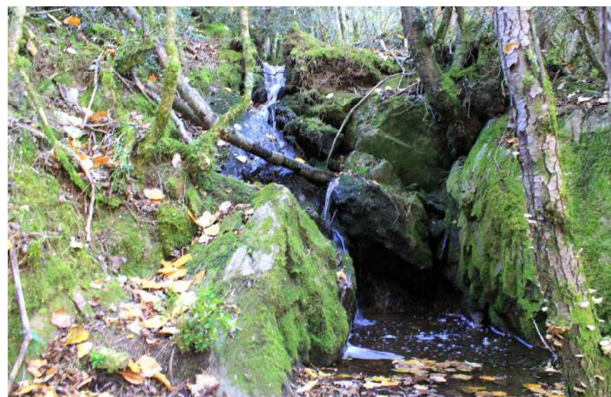
Sender al costat del riu Segre