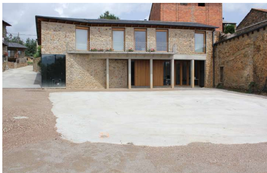
Espai de plaça que s'ha guanyat amb l'enderroc

Durant les primeres setmanes del mes de maig, es va realitzar l'enderroc de l'antic edifici de l'Ajuntament. Aquesta actuació és la que fa possible l'ampliació de la Plaça Major d'All i la seva reestructuració general.