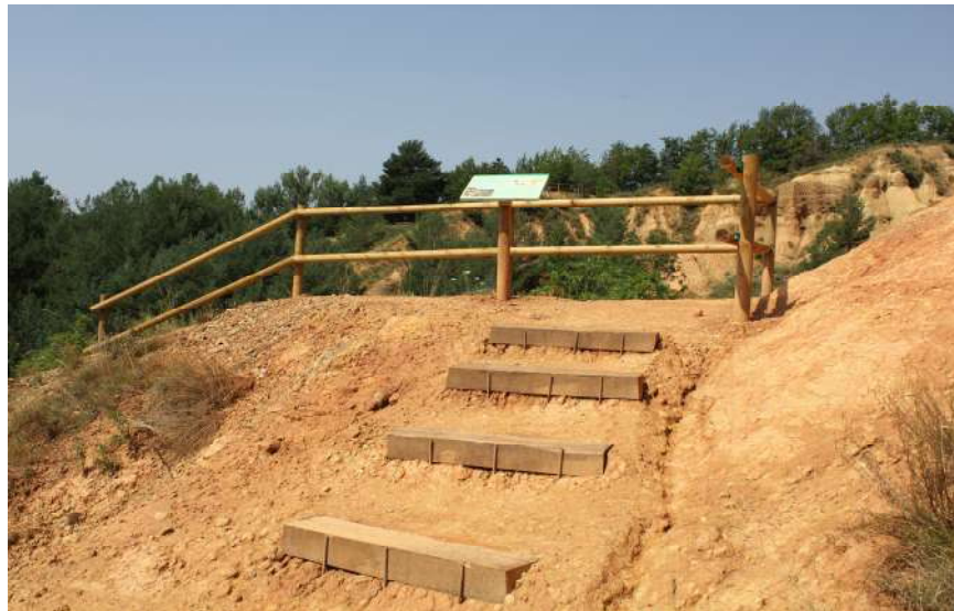
En tot el recorregut, s'han instal·lat esgraons per facilitar l'accés i minimitzar el màxim possible l'impacte en l'entorn