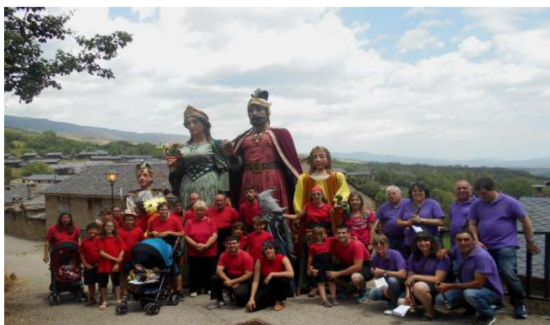
Les Colles Geganteres i Gralleres de Manlleu i Queixans

popular i a la tarda es va celebrar el ball de fi de festa amb el grup Paris la Nuit .