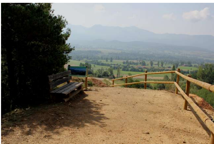
Un dels miradors amb panell informatiu