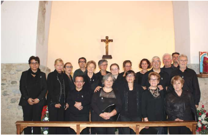
Els membres de la coral Capella de Santa Maria

L'Aplec Mare de Déu de Quadres és un dels actes festius més tradicionals que celebrem anualment al nostre municipi i també un dels més especials: l'ambient, el lloc, la gent, tot acompanya per a passar un dia en companyia molt agradable.