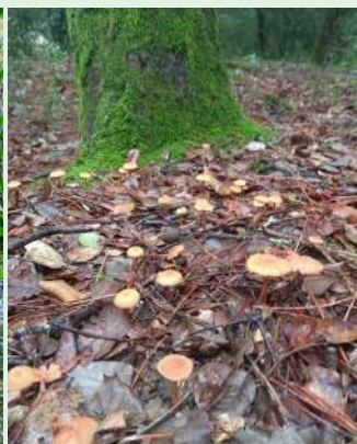
7.- Miquel Àngel Velarde