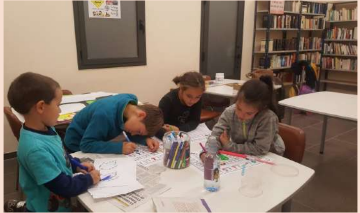
El dia 16 de novembre vàrem celebrar el dia internacional per la tolerància realitzant diferents activitats lúdiques.