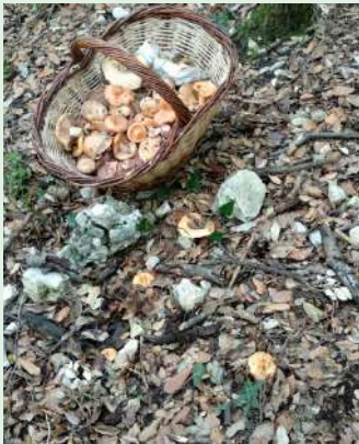
1.- Àlex Torrentà

En aquesta edició de la Revista de Rocacorba, hem volgut que el poble tingui més veu que mai demanant fotografies de la tardor fetes al nostre municipi. L'equip redactor de la revista ha escollit com a fotografia guanyadora i per tant, portada d'aquesta edició, la fotografia de la Lidia Coll. Aquí teniu un petit mostreig d'algunes fotos que hem rebut. Moltes gràcies a tots per participar i col·laborar amb la revista!