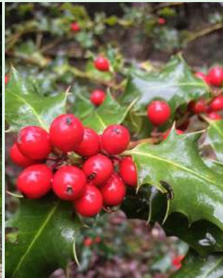
3.- Cristina Bell-Iloch