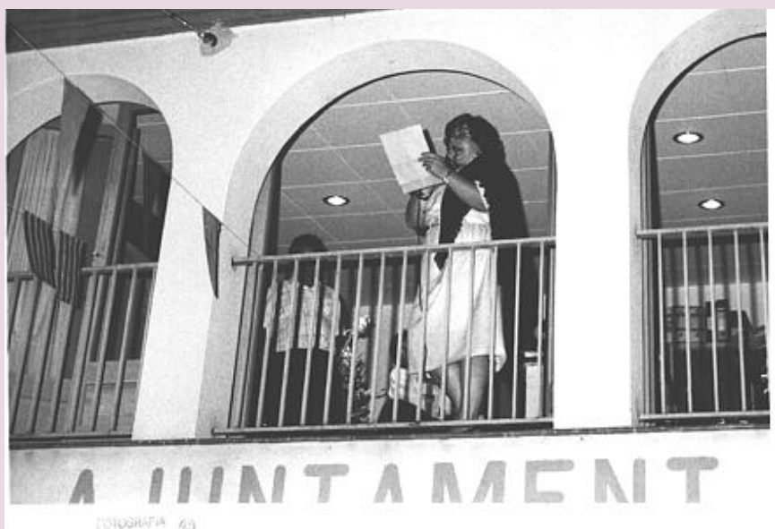
Fent el pregó per la Festa Major de Canet d'Adri

En el seu paper de Secretaria sempre ha tingut una molt bona relació amb els veïns, tot i que li hauria agradat poder ser més divertida. Considera que el seu deure era defensar un paper que no era sempre