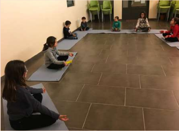
Taller de Relaxació i massatges amb els nens i nenes de l'espai social.