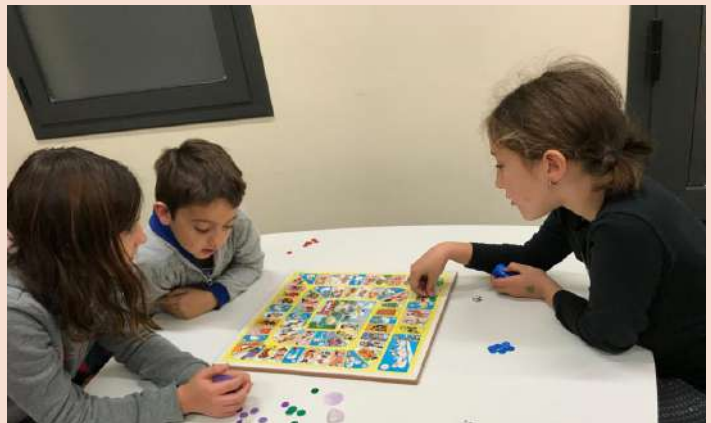
El dimarts 4 de desembre vam passar la tarda jugant als jocs tradicionals de taula, com la oca, parxís, etc.