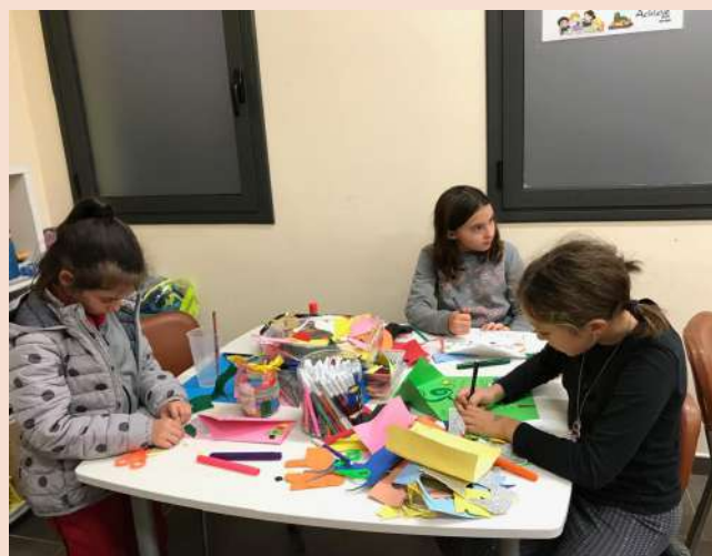
Fent postals de felicitació pels nostres amics i familiars