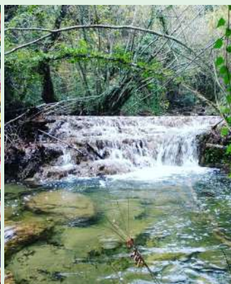
6.- Júlia Grabulosa