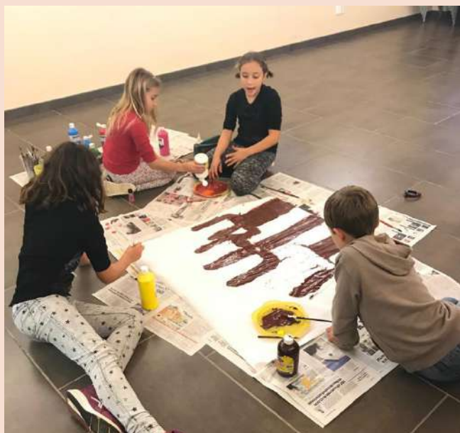
Activitat infantil "Pintem un mural de la Tardor"