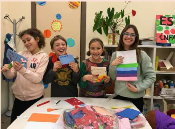
Tarda de manualitats! Hem fet postals i ens ho hem passat molt bé!