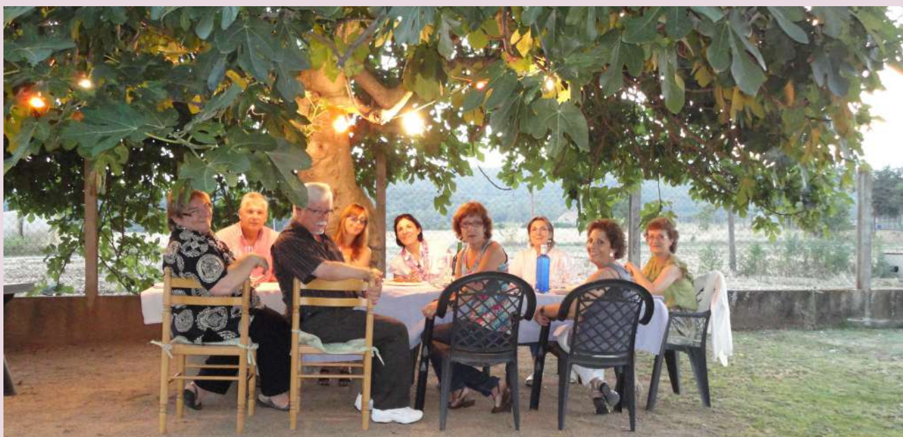
Sopar d'amics a casa sota la figuera