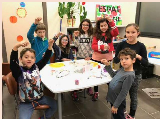
Tarda divertida dissenyant collarets i polseres personalitzades!