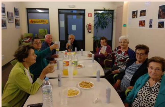
Després de l'activitat d'estimulació cognitiva, gaudint d'un bon berenar.

Atenció!, queda inaugurada la temporada 2018-2019 de l'espai social de l'Ajuntament de Canet d'Adri. Pels més petits del poble obrim dilluns, dimarts, dimecres i divendres de 15:30-20:00. Com a novetat, aquest any els dimarts anirem al pavelló a realitzar activitats