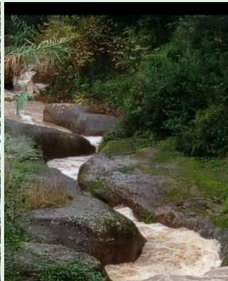
2.- Angelina Oliveras