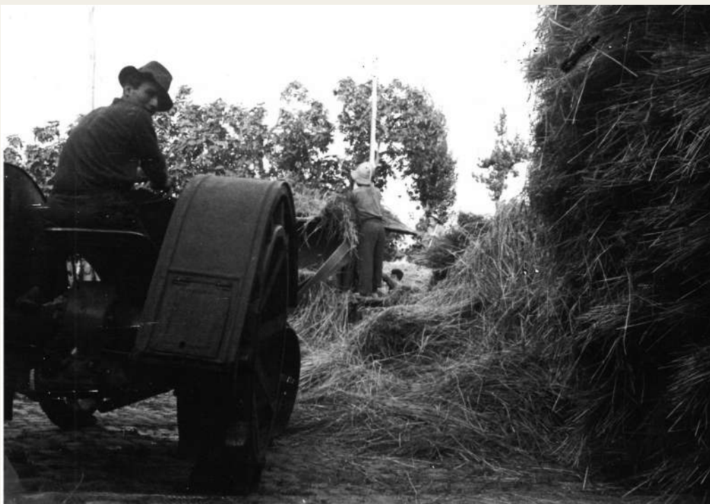
Batuda tradicional a La Torre - 1976

El document correspon a la campanya de trilla, que vindria a ser com la campanya del batre, que la Trilladora Avellana va fer l'any 1958. Apareixen els noms dels propietaris dels camps, el domicili i poble, les hores treballades i el pagament que els hi corresponia.