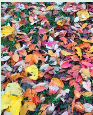
5.- Joaquim Pelach