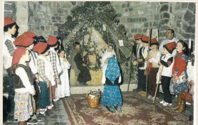
Pessebre Vivent a la Missa del Gall de Cane, l'any 1982