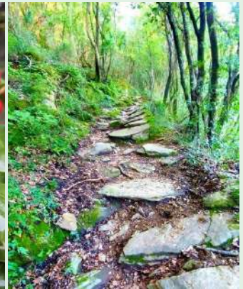
4.- Glòria Armengol