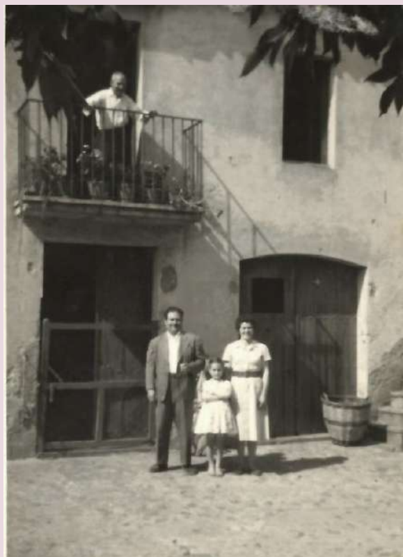
Amb els pares a Mas Gironès Nou de Cartellà