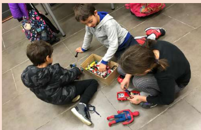
Activitat de construcció.