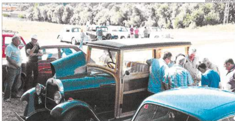
JOSEP MARIA BARTOMEU

agruparà totes les entitats del poble "amb l'objectiu de treballar junts pel municipi", explica Espigol. Així es vol dotar de més transparència la gestió. ■