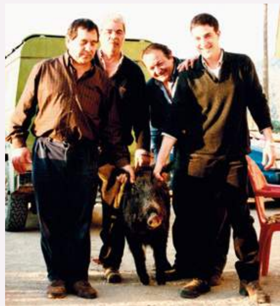
La colla de Canet amb el senglar de "protagonista"