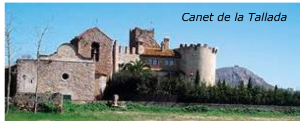
Canet de la Tallada

Sabies que... aquest 2015 ha estat l'Any Internacional de la Llum? Com tot sabem, la llum juga un paper clau en la nostra vida quotidiana. Només cal veure què passa quan ens treuen la llum durant mitja horeta...ja posem el crit al cel...!!!