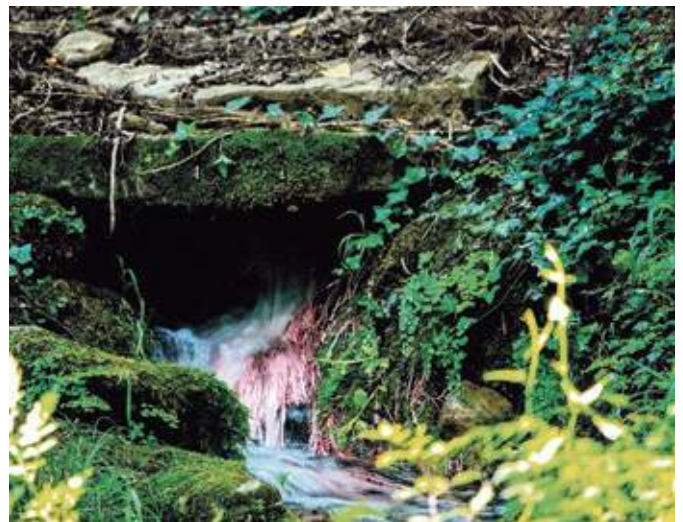
Fotografia guanyadora del concurs de fotografia d'aquest any

3r.- "La nostra terra" – Desenfoque (Benito Siles, Girona)