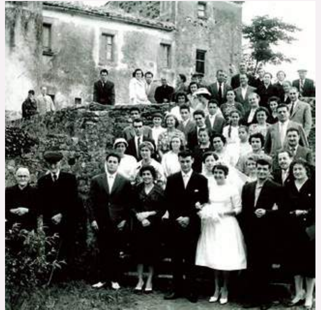
Enllaç nupcional a la parròquia d'Adri (1958).