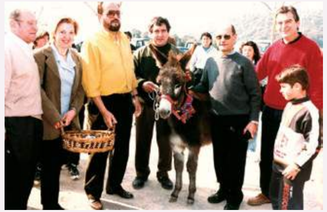
Moment del bateig del burro