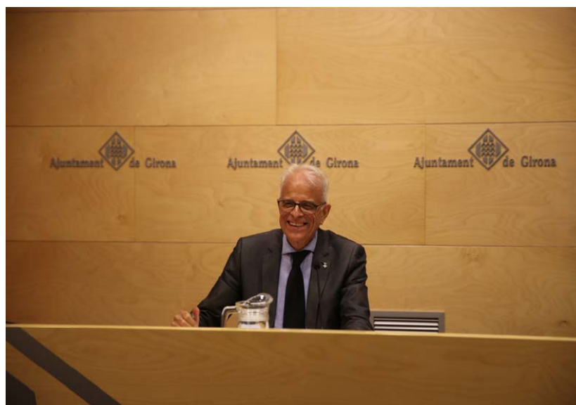
Imatge de la roda de premsa de presentació dels resultats de la consulta. 25 de juny de 2018.

Atenció Ciutadana als barris (en el seu horari habitual) va informar i ajudar a emetre el vot a totes aquelles persones que ho necessitaven durant els dies de votació electrònica.