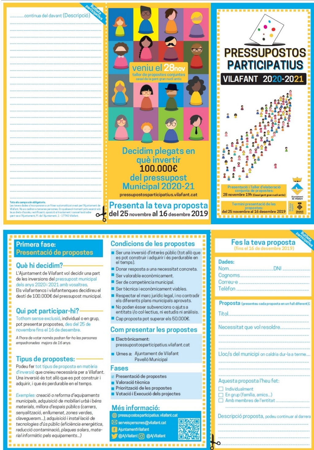
Tríptic recollida de propostes