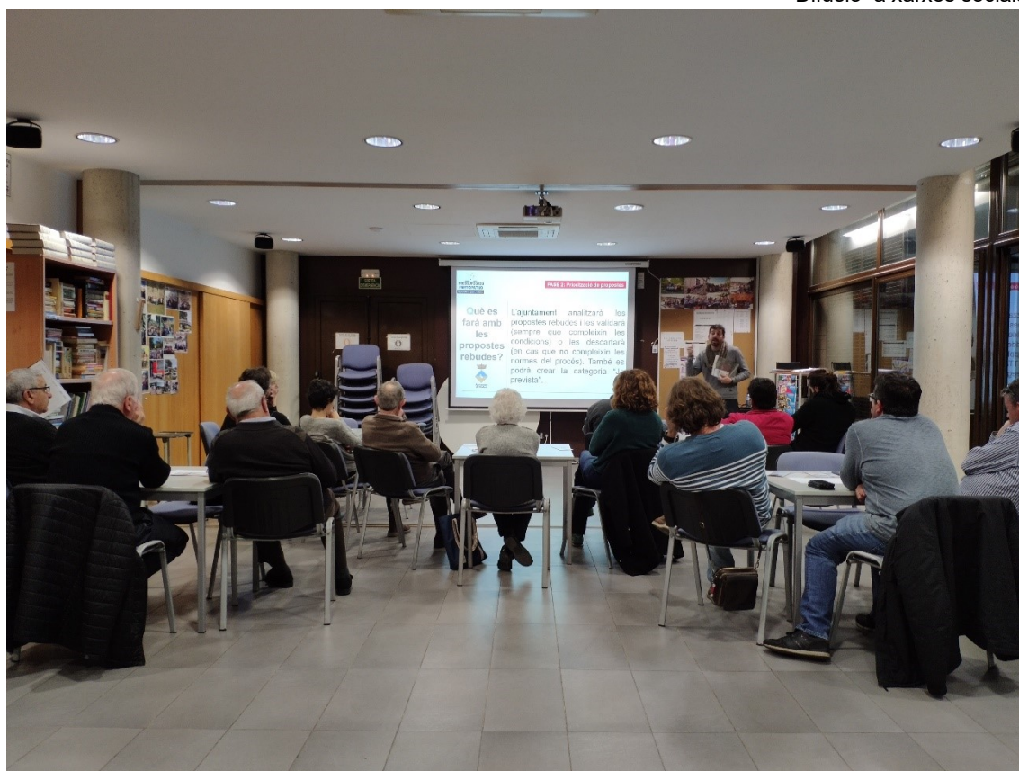
Assistents del taller informatiu 28/11/2019