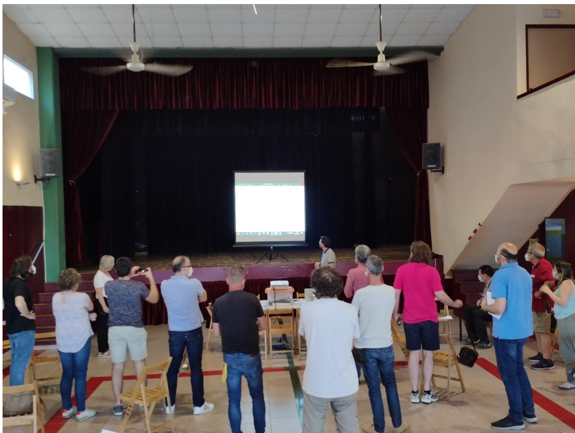
Anunci dels resultats