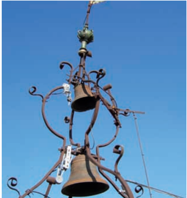
Primer pla del forjat de ferro de la part superior del campanar. Aquest element també es trobava molt degradat, sobretot en la seva base, de forma que els seus ancoratges havien cedit, raó per la qual s'inclinava d'una forma perillosa.

Posteriorment, a la segona meitat del segle XVI, l'edifici fou novament modificat i ampliat, probablement a causa de la necessitat de substituir la coberta de fusta gòtica, que ja tenia quasi dos-cents anys. En conseqüència, es reformà