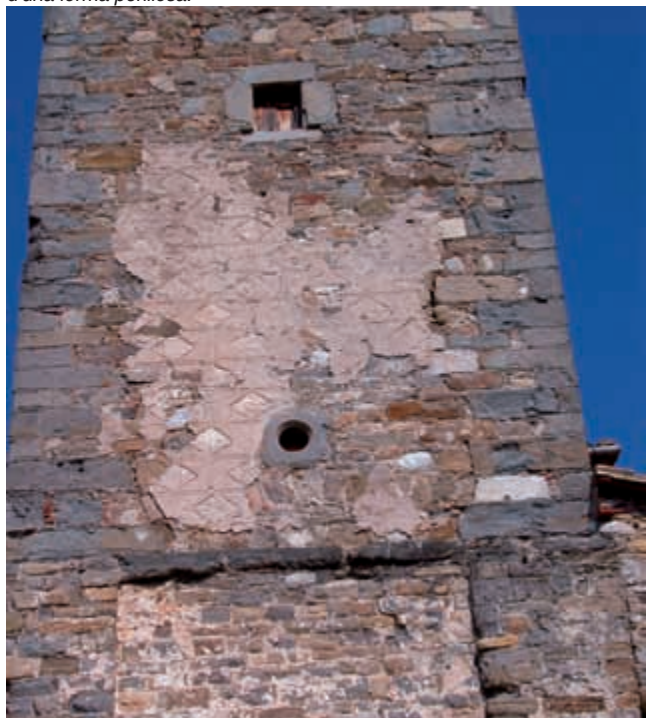
Vista parcial del campanar de l'església parroquial, en la qual s'hi pot observar clarament que la part inferior d'aquest element és d'estil romànic, atès que presenta les seves característiques faixes llombardes. Aquest és l'element que millor resistí els terratrèmols del segle XV, d'aquí que es conservi en bona part. La part superior fou reconstruïda quasi totalment entre el segle XVII i XVIII, i va ser arremolinat i decorat amb motius romboïdals, com es pot observar clarament en aquesta imatge.