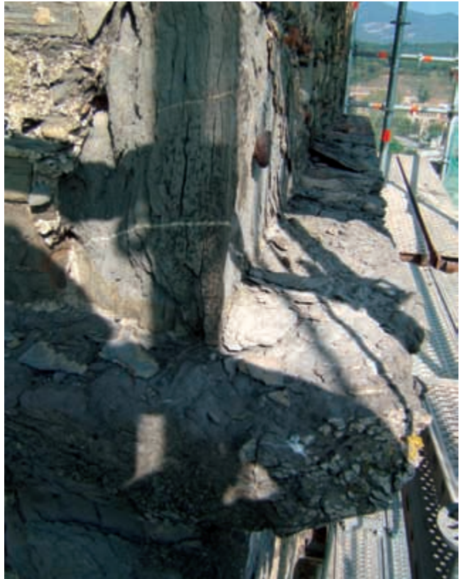
Primer pla d'una de les cornises del campanar. Aquest element es trobava clarament deteriorat i erosionat pel pas del temps i l'erosió, raó per la qual s'ha hagut de substituir, atès que era un perill evident per als veïns i visitants.

En definitiva, a conseqüència d'aquests fets, el projecte ha sofert una modificació important consistent a refer els tres nivells de cornises de pedra, com ja s'ha esmentat per