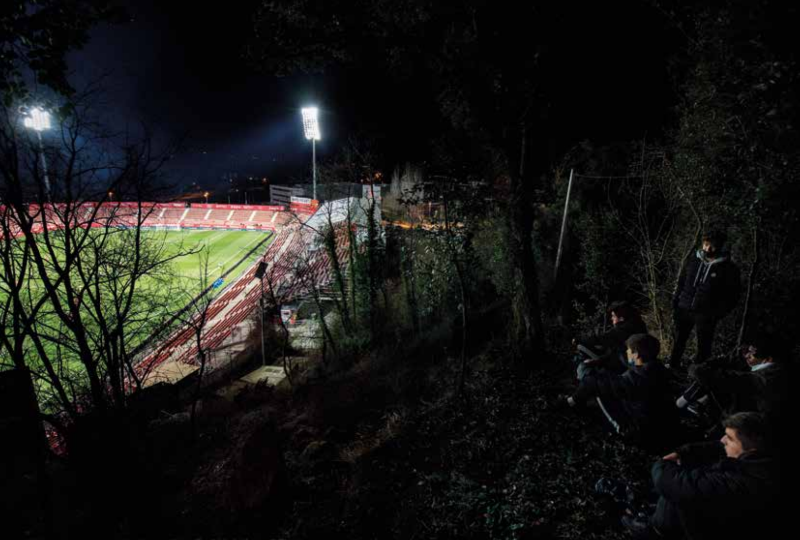
Ganes de futbol. Camp de futbol del Girona FC, 23 de gener de 2021 Carles Palacio i Berta