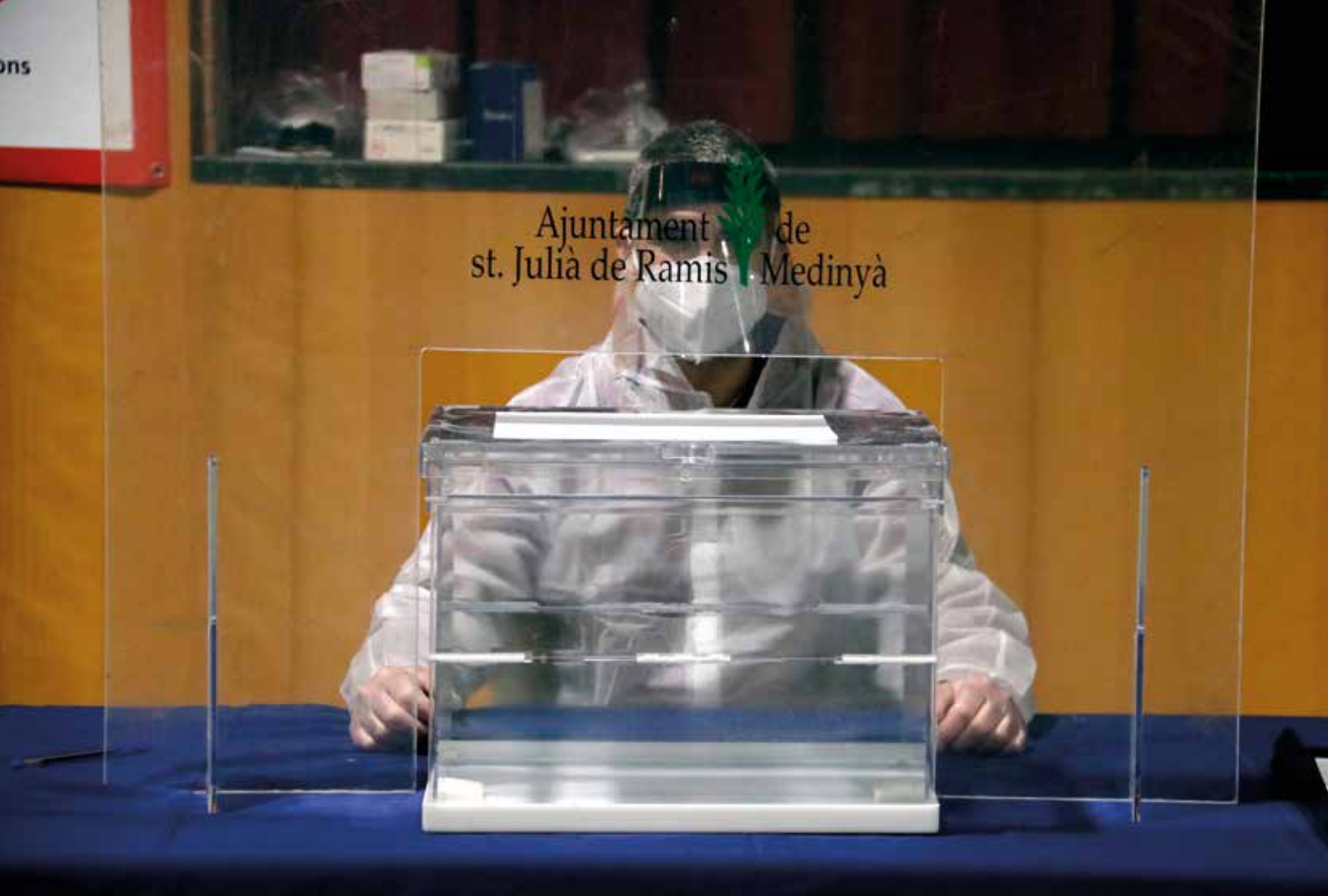
Eleccions en pandèmia. Sant Julià de Ramis, 4 de febrer de 2021 Marina López Pérez

«A les portes de les primeres eleccions en pandèmia, la gran pregunta era com es garantirien les mesures contra la covid-19. L'Agència Catalana de Notícies (ACN) va tenir en exclusiva les fotografies del primer simulacre que se'n va fer a Catalunya. Va ser a Sant Julià de Ramis, on van explicar als membres de les meses com s'havien de posar els EPI i de quina manera es controlarien les cues de votació per evitar contagis. Per primer cop, darrere les urnes, pantalles de metacrilat, mascaretes, ulleres i granotes per protegir els presidents i els vocals de les meses de votació. Aquestes fotos van ser a la majoria de portades dels diaris.»