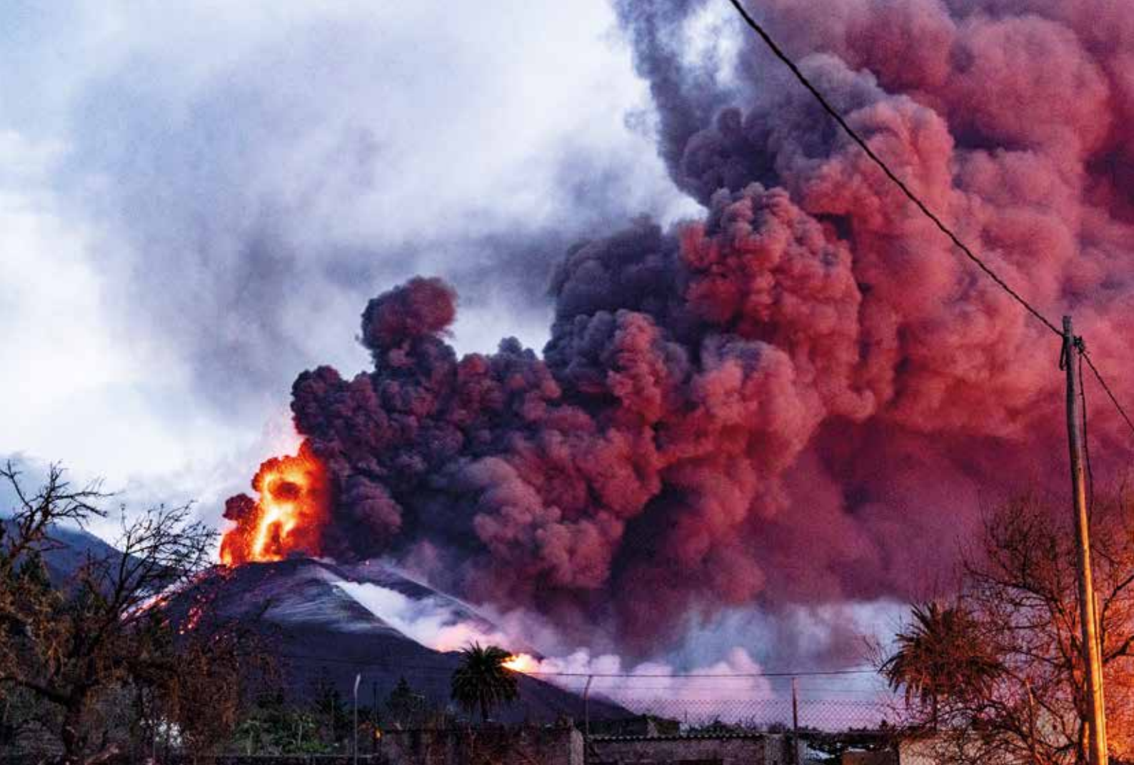
La fúria del volcà. Illa de La Palma, 17 de novembre de 2021 Miquel Riera Planas