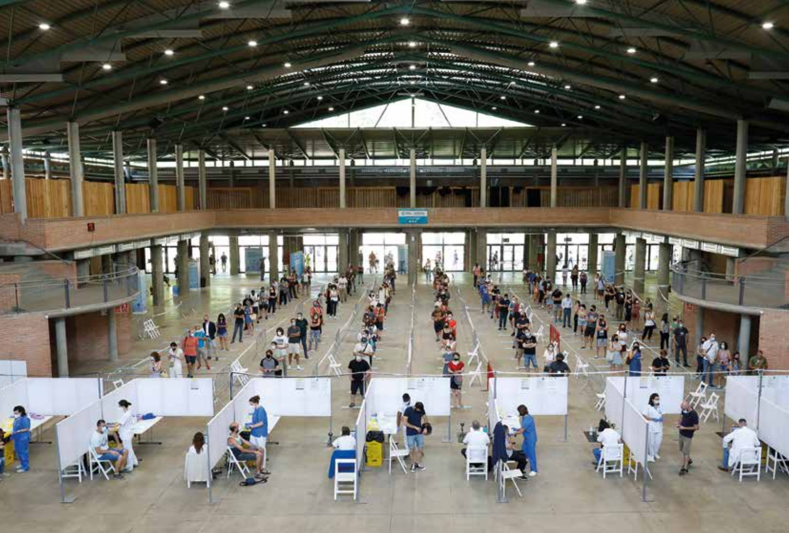
Vacunòdrom. Girona, 14 de juny de 2021 Aniol Resclosa i Planes

«La fotografia correspon al punt de vacunació massiu que es va instal·lar al Palau de Fires de Girona per agilitzar la vacunació contra la covid-19 a tota la població. En la imatge es mostren les cues, llargues i ordenades, que es creaven a l'interior del Palau en els moments de més activitat.»