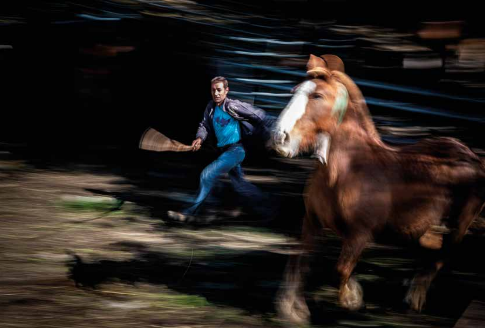
La tria. Espinavell, 13 d'octubre de 2021 Jordi Borràs Abelló

«El 13 d'octubre, dia de Sant Eduard, els eugassers de Molló i de la vall de Camprodon van a buscar el bestiar. Per Sant Joan l'han dut a pasturar als prats de Rojà, una muntanya del massís del Canigó, a l'altra banda de la frontera, que parteix Catalunya des del Tractat dels Pirineus. Dies abans, els ramaders han dut les eugues i els seus pollins — mulats , com mana el parlar d'aquestes valls— cap al peu del pic de Costabona. Per Sant Eduard es baixen els escamots d'eugues cap a Espinavell, on es fa la tria —se separen mulats i eugues— i els ramaders tanquen els tractes dels animals que volen vendre o comprar. Aquest és un dia important, dia de fira, de concurs i, sobretot, de trobar-se amb la resta d'eugassers i vaquers vinguts del Ripollès i del Vallespir.»