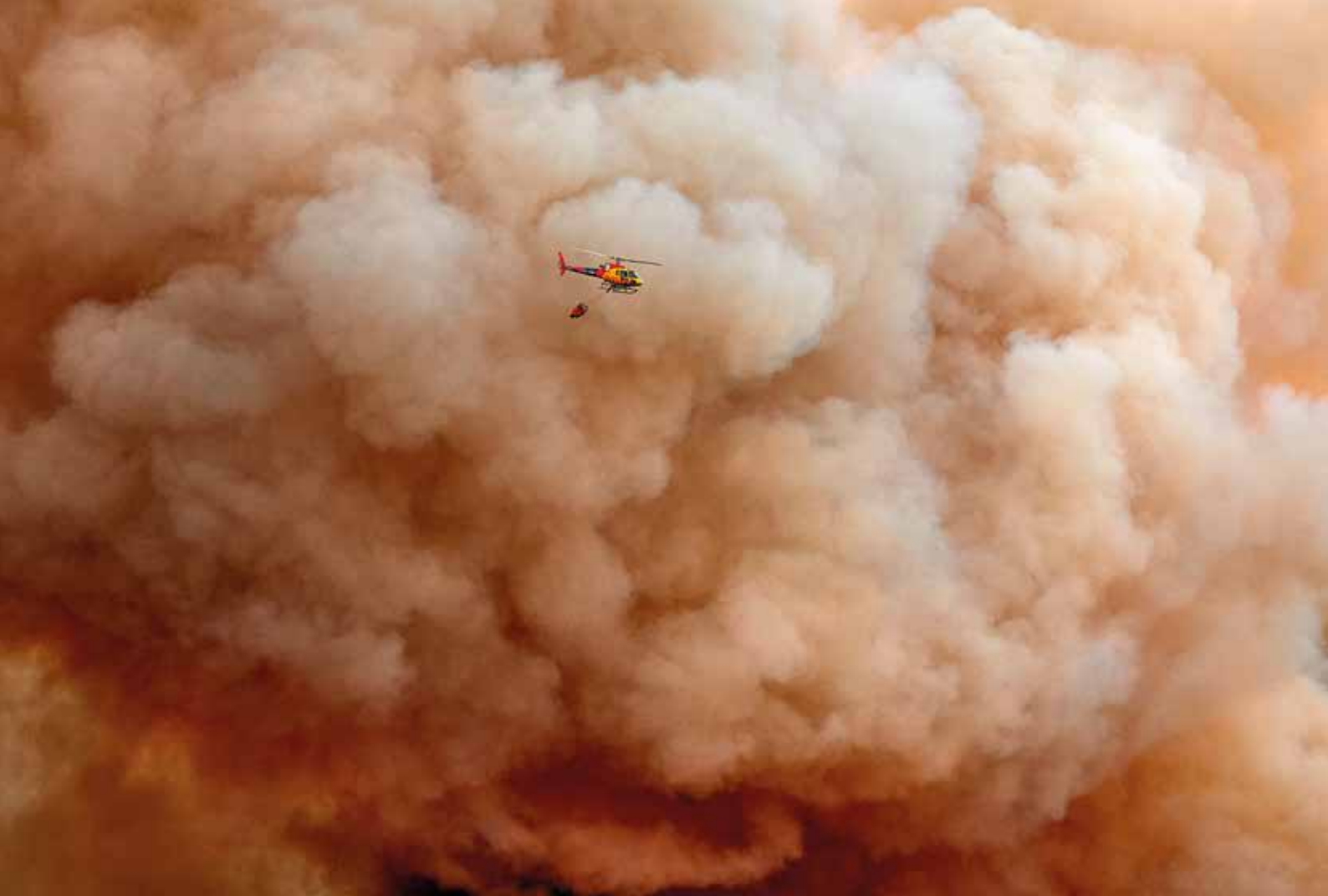
Incendi forestal al massís del Montgrí. Bellcaire d'Empordà, 22 de juliol de 2021 David Borrat Martos