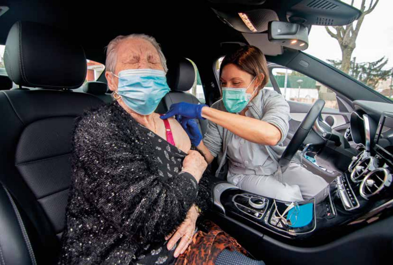
Vacunació de gent gran contra la covid-19. Cassà de la Selva, abril de 2021 Eduard Duran Abad

«La covid-19 ha comportat molts canvis a la nostra societat i ha afectat de manera molt especial la gent gran. Aquest col·lectiu va ser el primer de rebre les dosis de vacunes contra el coronavirus, si bé no sempre en condicions òptimes. La foto reflecteix un moment d'aquest procés de vacunació, que va obligar sanitaris i usuaris a adaptar-se a les particularitats de llocs no pensats per posar vacunes, com ara els cotxes.»