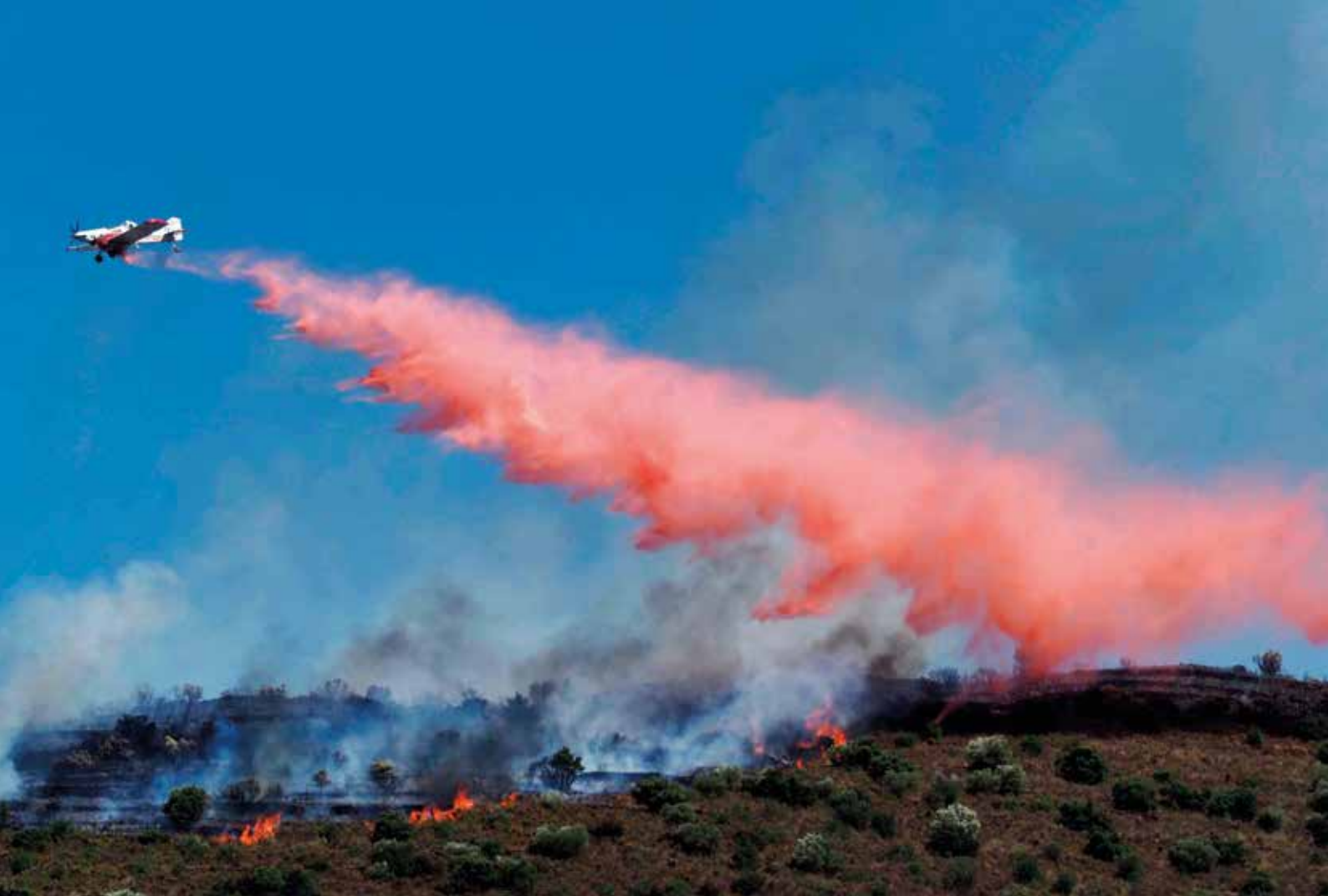
Incendi forestal al cap de Creus. Llançà, 16 de juliol de 2021 Pere Duran i Serrats

«Diversos incendis forestals van posar en alerta la població durant l'estiu, especialment el de la zona del cap de Creus, entre Llançà i el Port de la Selva, i el de la serra del Montgrí, a Sobrestany.»