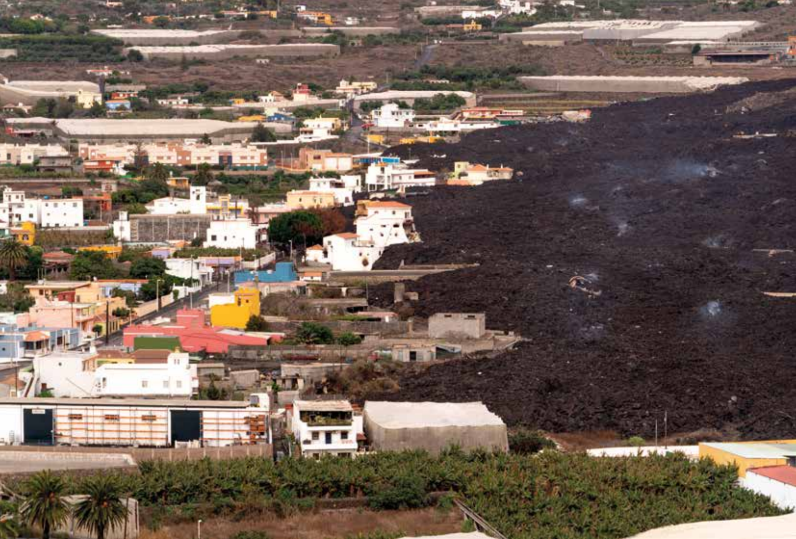
La Laguna, assetjada per la lava. Illa de La Palma, 17 de novembre de 2021 Miquel Riera Planas

«El 19 de setembre del 2021 feia erupció el volcà de Cumbre Vieja, a l'illa canària de La Palma. Rius de lava van començar a baixar muntanya avall i destruïen tot el que trobaven al seu pas. Quan feia gairebé dos mesos de l'inici de l'erupció, vam anar a La Palma per fer-hi un treball periodístic i vam poder retratar el volcà, que en aquells moments encara expulsava lava, cendra i gasos amb molta força. L'erupció es va donar per acabada el dia de Nadal, després de deu dies sense activitat volcànica.»