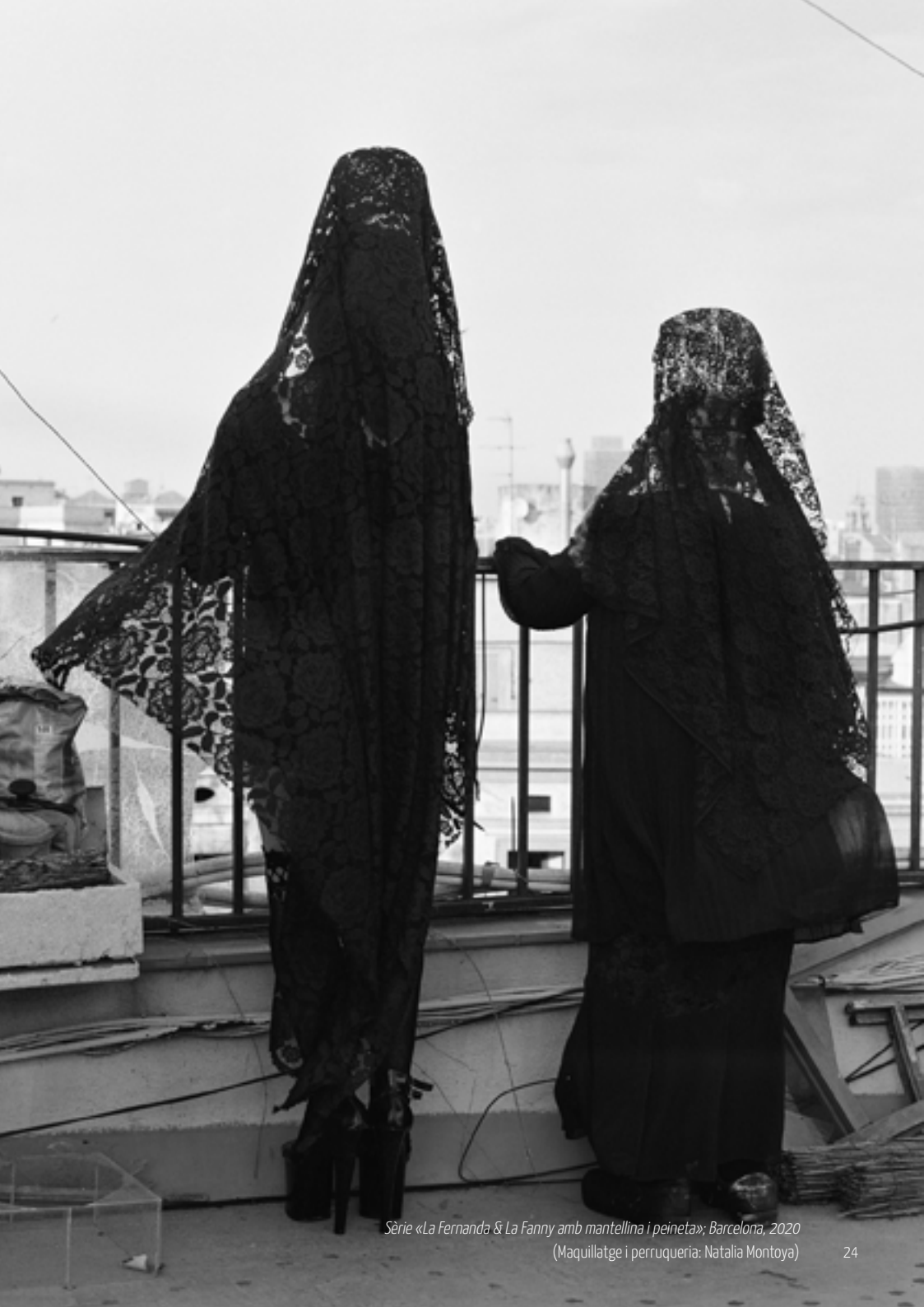
Sèrie «La Fernanda & La Fanny amb mantellina i peinetas»; Barcelona, 2020 (Maquillatge i perruqueria: Natalia Montoya)