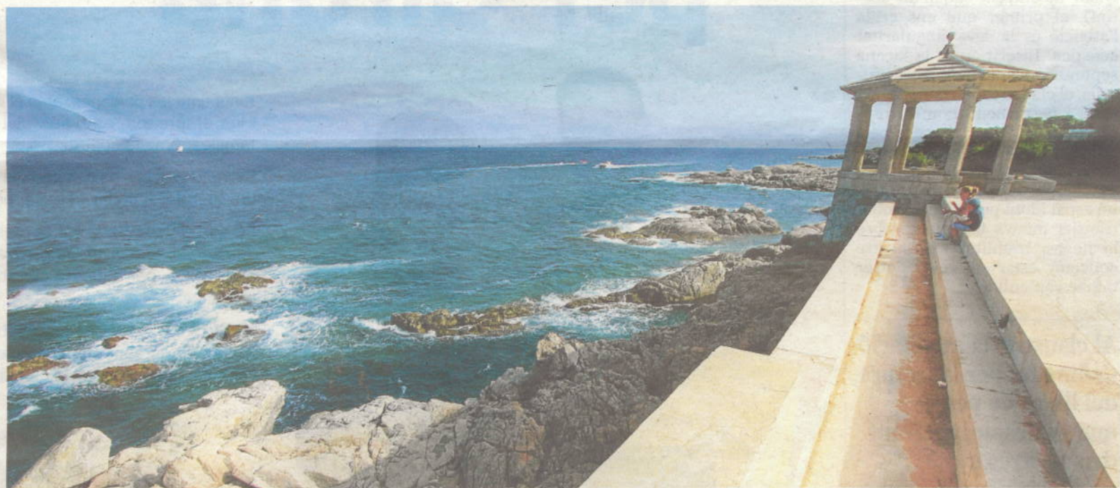
Un dels paratges que es poden contemplar des del camí de ronda de S'Agaró

Cita també com a bons badadors els més destacats gratacels aixecats a la Costa Brava en els anys de desori turístic, com els de Palamós o els situats a la proximitat de la desembocadura de la Muga. Menys assequibles són les antenes de telecomunicacions, miradors reservats als tècnics que tenen autorització per enfilars-hi. Una de les informacions més curioses que dona és sobre els càlculs fets pels matemàtics empordanesos Simó Bosch i Lluís Sabater per saber amb certa precisió la superfície i la distància màxima visibles des d'un cim. D'aquesta manera van poder calcular fins on arribava la vista de Jesucrist quan va ser temptat pel dimoni i també l'extensió de terra que hauria obtingut si hagués cedit a les temptacions ofertes amb el "tibi dabo" satànic relatat a l'Evangelí de Sant Mateu.