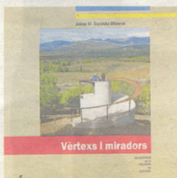
Portada del llibre

Això, que tindria un cert sentit per a una bibliografia orientativa, de les de "per a saber-ne més", sembla, en canvi, poc respectuós amb els autors dels quals s'han manllevat informacions, en obviar absolutament les fonts