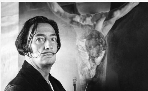
— Els catalans van crucificar Jesucrist, sosté Salvador Dalí