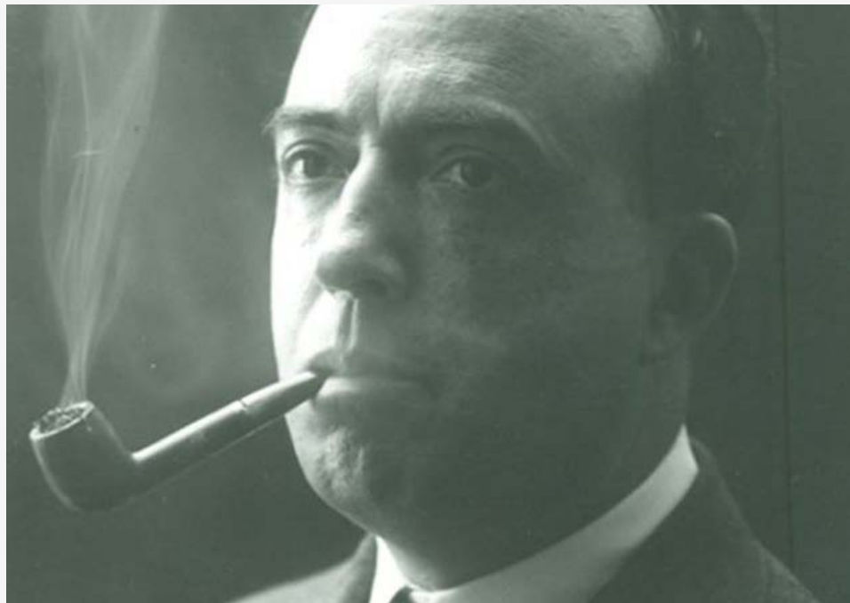
— Josep Carner publicava ara fa 100 anys 'La paraula en el vent'