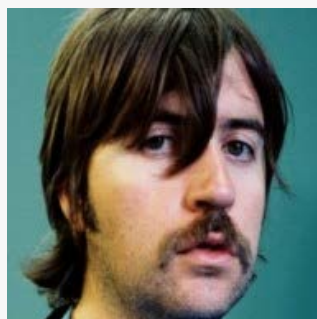
Albert Serra a la Tate Modern de Londres