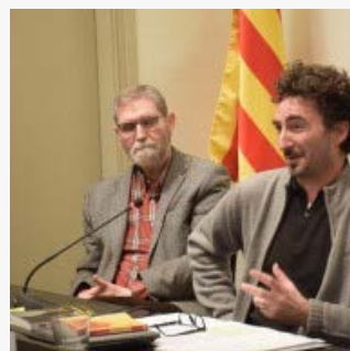
De mestretites, Catalunya n'és plena