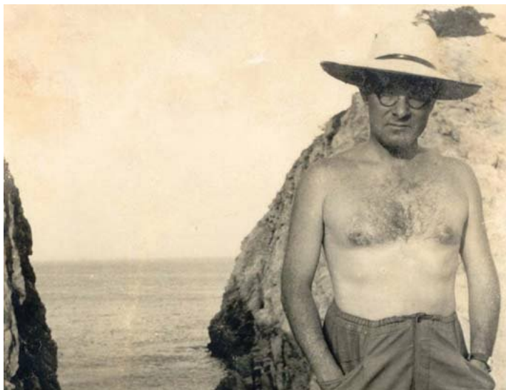
( http://www.nuvol.com/opinio/el-bany-de-joan-vinyoli/attachment/joan-vinyoli/ )