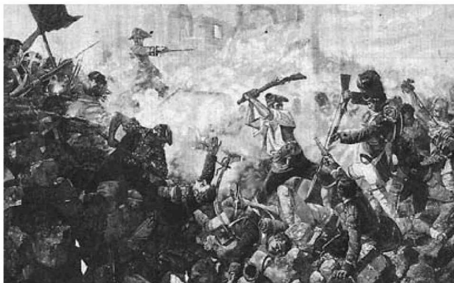
El gran dia de Girona , d'Álvarez Dumont, mitifica la defensa d'un dels setges.

Pel que fa al llibre de Morales i Bohigas, els autors han treballat un tema prou conegut —els setges de Girona del 1808 i el 1809— amb una mirada nova: el moviment de tropes, els desplaçaments de població que provocaren els