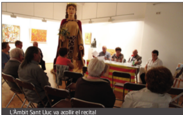
L'Àmbit Sant Lluç va acollir el recital