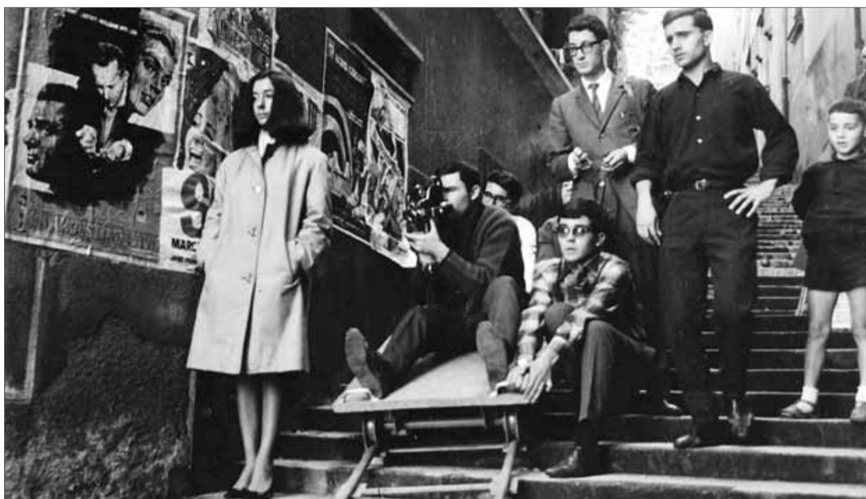
La pel·lícula 'Amor adolescente' tancarà dissabte vinent la 28a edició

Uns 300 films, sobretot curts i migmetratges, es projectaran als cinemes Albèniz Centre –al costat de la plaça Independència, la "plaça dels cines", on el festival té el seu epicentre social: l'envelat, el plató per a entrevistes, el photo-call –; la Casa de Cultura, on destacaran les produccions gironines i les web-sèries; la Fundació Valvi, seu de la secció Experimental , i la botiga Moby Disk de la Rambla, on es projectaran videoclips de