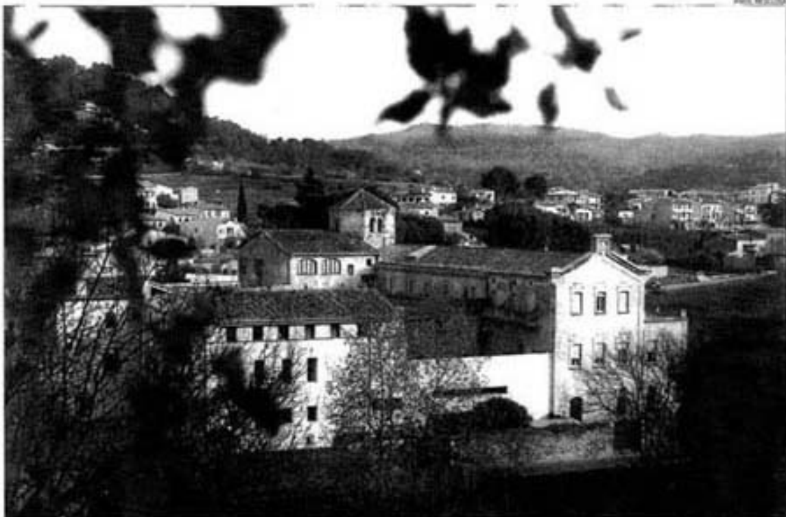
El monestir, fundat el 1015-1018 per la comtessa Ermessenda, acull les monges benedictines i, des del 1999, una residència d'estudiantes.

Encara que sembli mentida, Sant Daniel tenia Ajuntament amb alcalde i unes escoles, ja que la mainada nascuda a la vall era ben nombrosa.