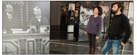
La mostra repassa la tasca de la Mancomunitat a Girona.

podrà. Tot seguit, la mostra continuarà el seu itinerari i es traslladarà a Lloret de Mar, on es podrà veure del 4 al 28 de febrer. L'exposició s'emmarca en el conjunt d'accions que la Diputació de Girona duu a terme per commemorar el centenari de la creació de la Mancomunitat.