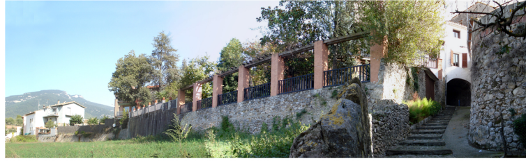
105Panorposterior illa 325-328.jpg