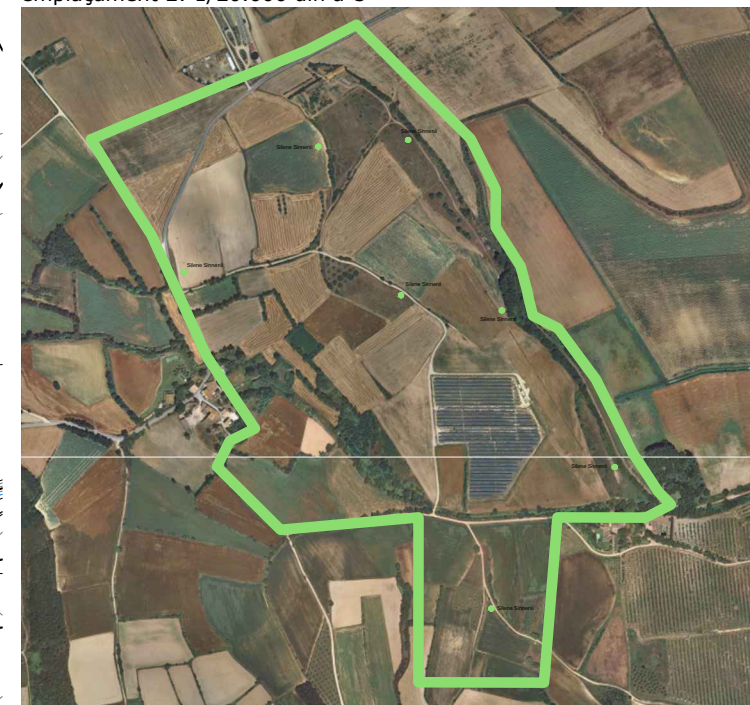
ortofotomapa E: 1/15.000 din a-3