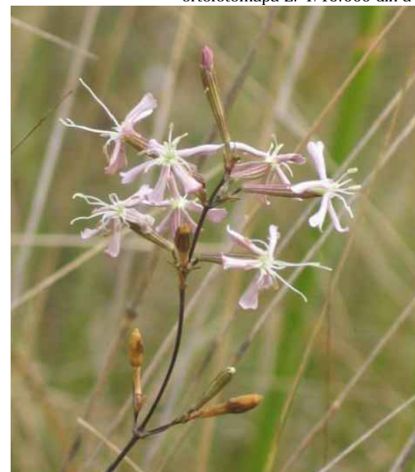
imatge silene sennenii - 02