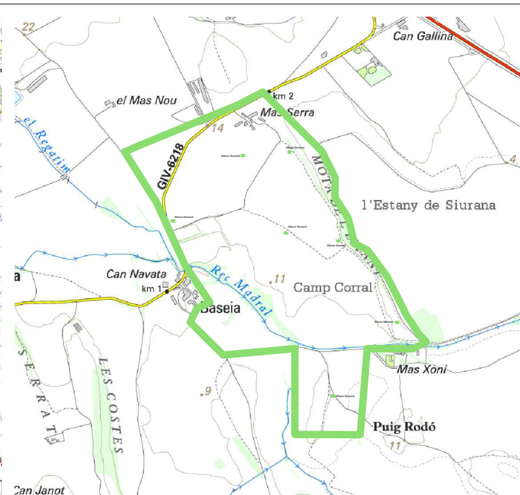
emplaçament E: 1/20.000 din a-3