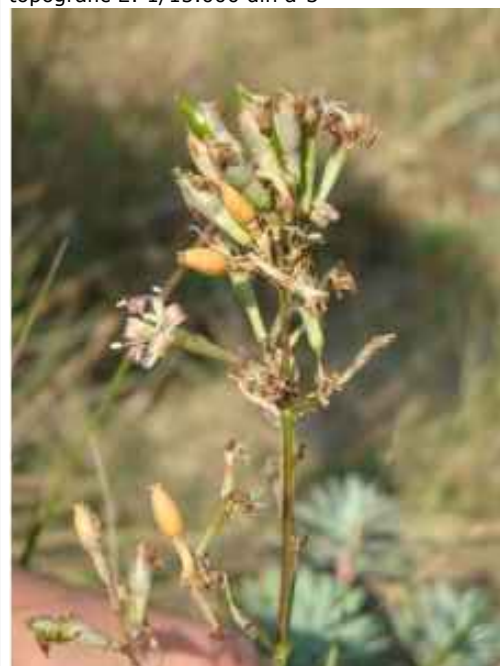
imatge silene sennenii - 01