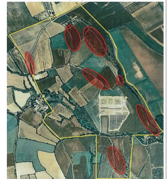
població de Silene sennenii zona Baseia 1/15.000 din a-3

Departament de Medi Ambient i Habitatge : zones de distribució principal de l'espècie. zones crítiques per a la seva conservació.