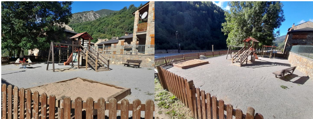
Parc infantil actual, amb canvi dels elements de fusta malmesos, canvi de sorra i terrari