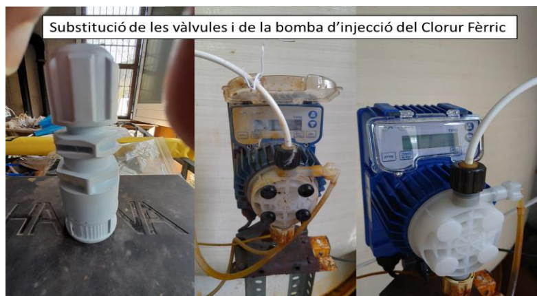
Substitució de les vàlvules i de la bomba d'injecció del Clorur Fèrric

Amb aquestes actuacions sembla ser que, de moment els nivells d'arsènic s'han normalitzat i l'aigua torna a ser apta pel consum humà. Després d'aquestes actuacions l'aigua de Setcases torna a ser apta pel consum humà