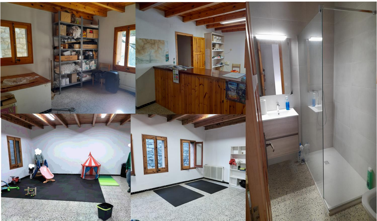
Estat del primer pis de l'edifici "els estudis" després de les petites reformes efectuades