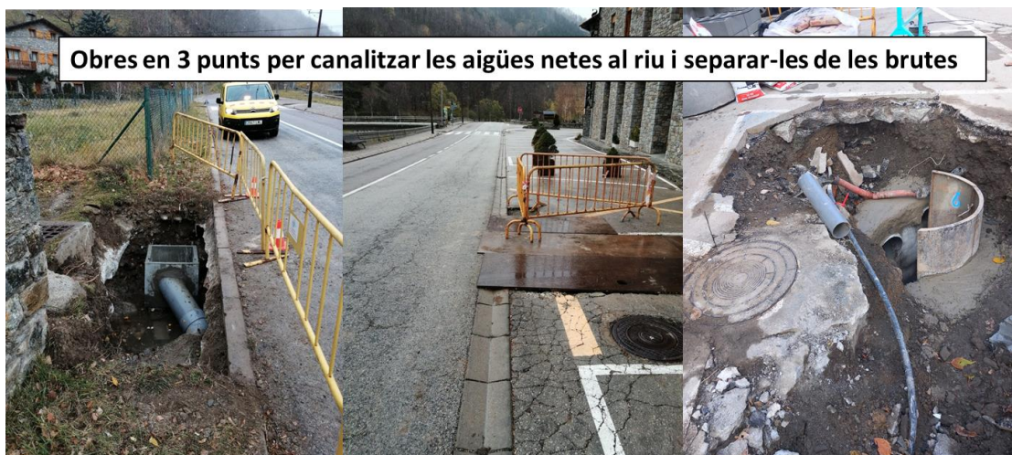
Obres per part de Consell Comarcal per separar les aigües brutes de les netes en tres punts on s'ha trobat un barri barreig excessiu

les obres necessàries per trobar els llocs on hi havia més barri barreig d'aigües netes i brutes. La brigada del Consell Comarcal va venir i va constatar tres punts on hi havia aquest problema i s'han efectuat les obres per, en el possible, separar les aigües netes de les aigües brutes.