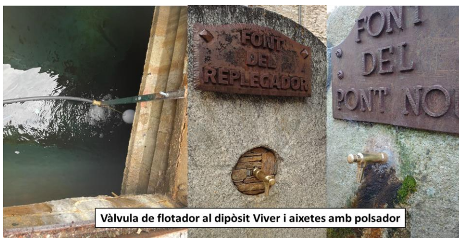
Vàlvula de flotador al dipòsit Viver i aixetes amb polsador

Cost de totes aquestes actuacions (exceptuant el Viver): al voltant de 4.500€.