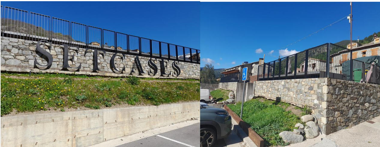
Plaça Verda amb les baranes de seguretat col·locades