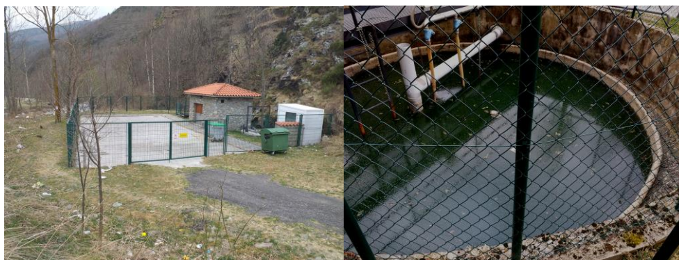
Depuradora de Setcases. Any construcció: 2003

Ens aquest 11 mesos de legislatura es va recollir i documentar informació, tant gràfica, com de recollida de mostres i es va transmetre als organismes competents, que la depuradora "no depurava" i que embrutíem un riu pràcticament acabat de néixer.