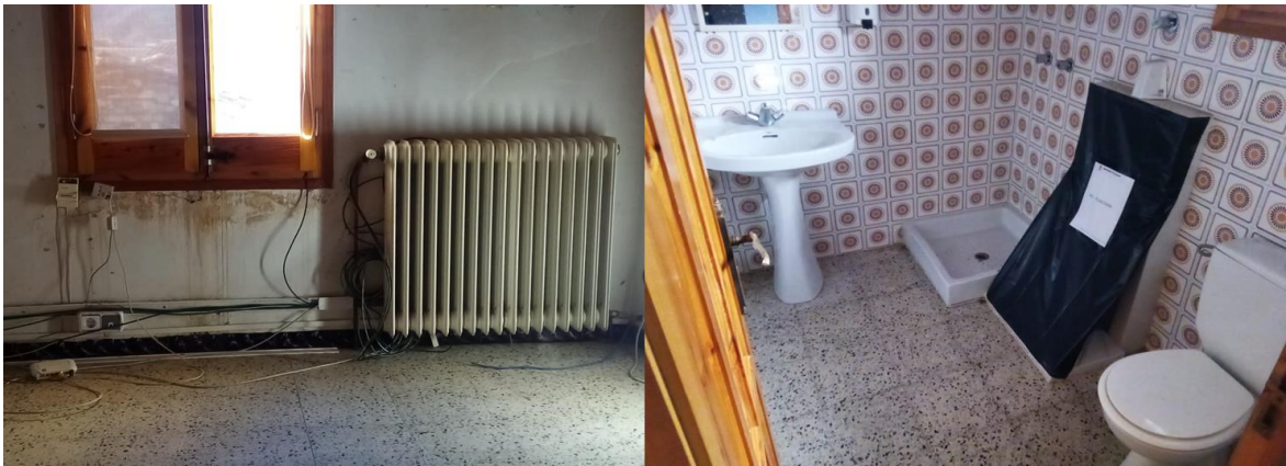
Estat de les dependències a principis 2022

La sala gran es pels més petits. La sala del mig, la del mostrador, es on s'ha establert el Punt d'Informació del Parc Natura. En un altre sala està el vestuari del brigada municipal i en un altre, un magatzem, ara ordenat, amb material de l'ajuntament. Per tant, a dia d'avui, aquets primer pis es una espai útil que proporciona serveis tant als veïns del poble com a les persones que ens visiten.