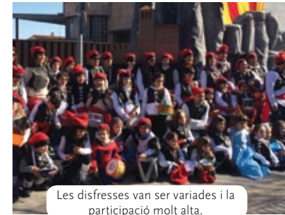
Les disfresses van ser variades i la participació molt alta.

La desfilada va comptar amb una bona participació