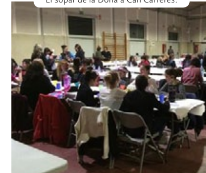
El sopar de la Dona a Can Carreres.

Els actes de celebració del dia de la Dona es van tancar a Porqueres amb el tradicional sopar de la Dona a Can Carreres, en el qual hi van participar un centenar de persones.