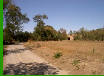
Camí cap el Mas Blall