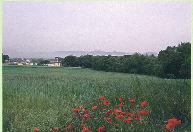
Roureda de Can Nosa, segons el POUM, zona verda.