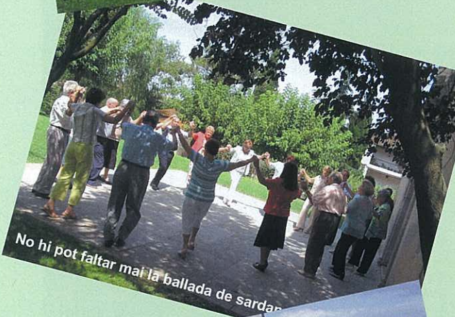
No hi pot faltar mai la ballada de sardan