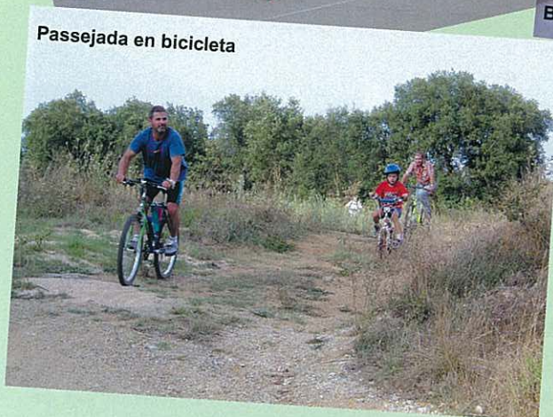
Passejada en bicicleta