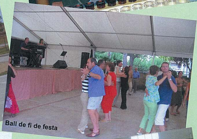
Ball de fi de festa