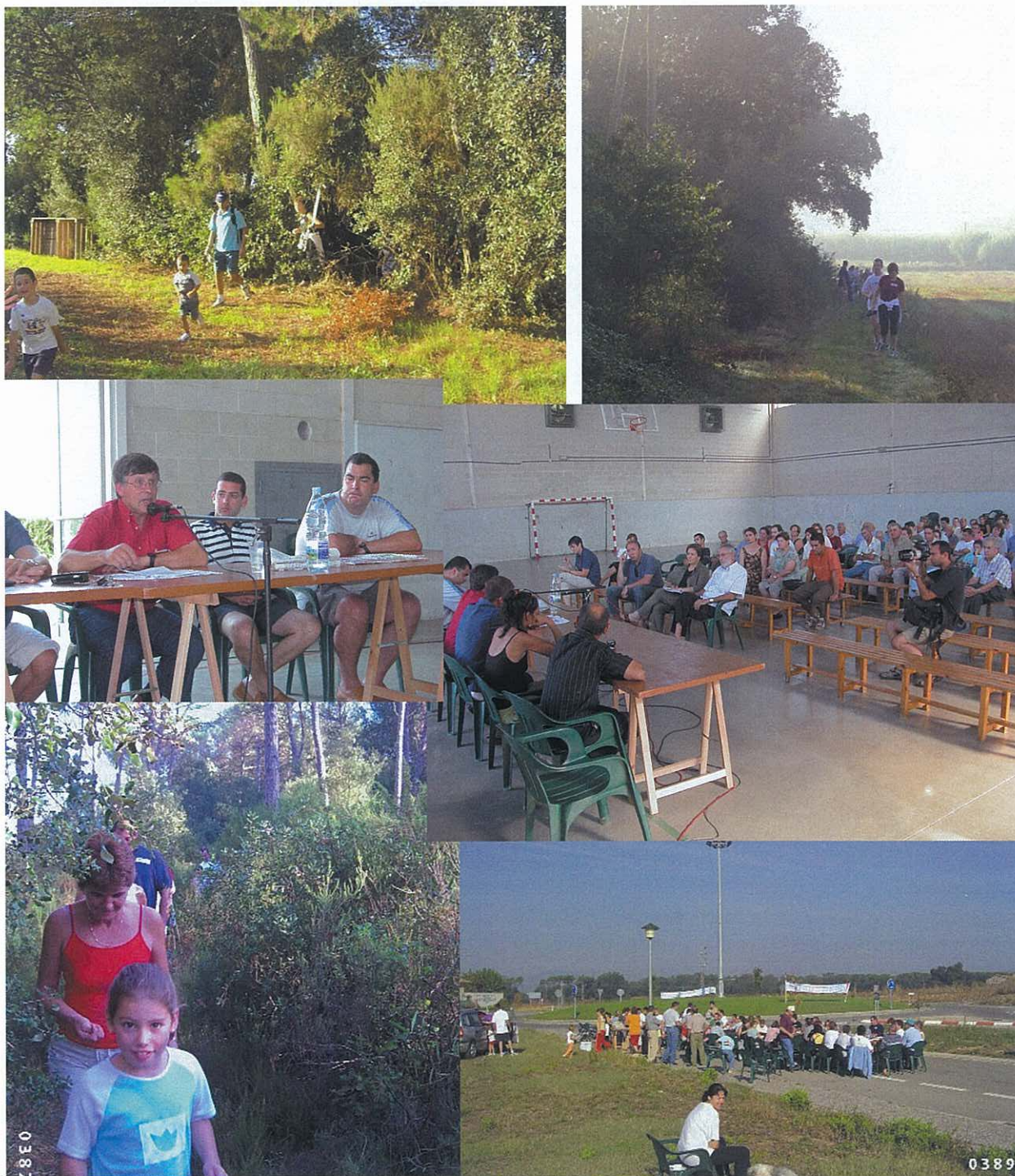
Imatges de la caminada, lligada enguany amb el rebuig al pas de l'Eix Transversal a Campllong