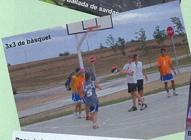
3x3 de bàsquet