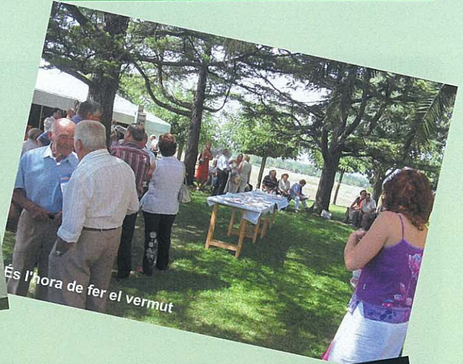
És l'hora de fer el vermut