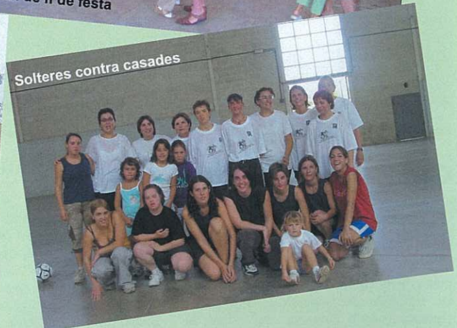
Solteres contra casades