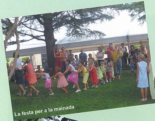
La festa per a la mainada