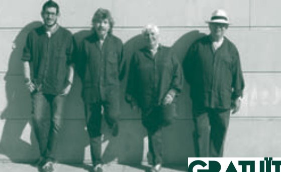
En cas de mal temps es farà a la Pista Poliesportiva. Organitza: Comissió de Festes de Bescanó

22h. Plaça Cantada d'havaneres ULTRAMAR Hi haurà rom cremat per a tothom!