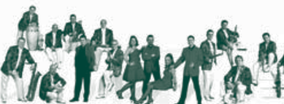
Les sardanes es faran davant el Casal d'Avis i el concert i ball a la Pista Poliesportiva. Aquest any, com a novetat, el ball es farà després del concert. Preu cadira: 2€ Organitza: Comissió de Festes de Bescanó

18h. Sardanes 19h. Concert Tot seguit. Gran Ball ORQUESTRA MARAVELLA Organitza: Comissió de Festes de Bescanó