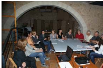
Imatge Consell Social de Vilademuls

Durant aquests mesos d'abril i maig s'han celebrat els Consells Socials Municipals de la Comarca del Pla de l'Estany. Així doncs, s'han reunit els Consells dels municipis de Camós, Cornellà del Terri, Palol de Revardit, Porqueres, Fontcoberta, Sant Miquel de Campmajor, Esponellà, Vilademuls, Crespà i Serinyà (en aquests moments l'únic municipi que encara no ha iniciat el procés de creació del consell social municipal és Banyoles).