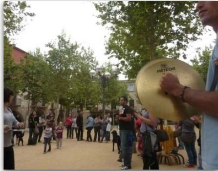
La concentració d' "indignats" de finals de maig a Banyoles.

La gent involucrada en el moviment dels “indignats” a la comarca del Pla de l'Estany està convocada avui a una nova assemblea, que començarà a les vuit del vespre a la plaça Major de Banyoles. La reunió estarà dedicada a debatre els continguts elaborats prèviament per les comissions de banca, política, medi ambient i comerç local. També es farà una valoració de les manifestacions que van tenir lloc diumenge passat. Altres qüestions que està previst tractar a l'assemblea d'avui és la possibilitat d'instal·lar un punt d'informació i la possibilitat de fer alguna acció de cara al proper cap de setmana, coincidint amb el festival de la veu Aphònica i la revetlla de Sant Joan.