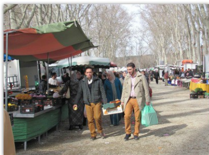
El mercat bisetmanal de la Devesa de Girona és un dels serveis que tenen el parc com a marc

Quatre associacions de veïns de la ciutat de Girona fan front comú per defensar el parc de la Devesa. Les entitats de veïns de la Rambla i Argenteria, Bonastruc i Figuerola, i Barri Vell i Sant Feliu expressen el suport explícit a l'associació de veïns de la Devesa-Güell en les seves reclamacions perquè s'apliquin amb urgència millores en aquest gran parc urbà. Les tres entitats de veïns lamenten que, "28 anys després de presentar-se un pla especial per al parc de la Devesa, l'espai continuï sense tenir cap solució per fer front a la degradació contínua que ha patit al llarg dels anys".