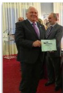
L'alcaldede Llagostera, ahir.

BARCELONA | ACN/DDG Els webs de 48 ajuntaments catalans, entre els quals es trobaven els de Llagostera i Celrà, van rebre ahir distincions a la qualitat i la transparència a través del Segell Infoparticipa, un distintiu creat pel Laboratori de Periodisme i Comunicació per a la Ciutadania Plural (LPCCP) de la UAB.