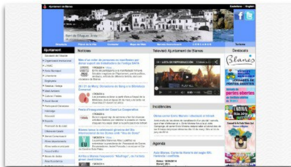
Captura de pantalla de l'Ajuntament de Blanes

Els webs de 48 ajuntaments catalans -3 d'ells gironins- han rebut aquest dimarts distincions a la qualitat i la transparència a través del Segell Infoparticipa, un distintiu creat pel Laboratori de Periodisme i Comunicació per a la Ciutadania Plural (LPCCP) de la UAB. El distintiu es basa en els resultats d'avaluar els webs a partir de 41 preguntes que indaguen sobre quatre qüestions bàsiques: qui són els representants polítics, com gestionen els recursos col·lectius, com informen de la gestió i quines eines ofereixen per a la participació ciutadana.